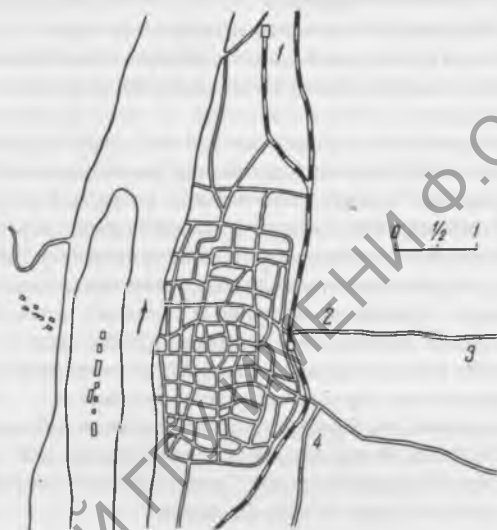
Рис. 4. Схематический план района раскопок в окрестностях Чанша. В центре — город Чанша, слева от которого протекает река Сянцзян. В середине реки — остров Шуйлужжоу. Под номерами на плане обозначены следующие пункты: 1 — Уцзялинь, 2 — Чэньцзядашань, 3 — Янцзяшань, 4 — Шицзылинь. Справа на карте масштаб в километрах

К северу, югу и востоку от города Чанша расположен район древних погребений. В период господства реакционной гоминдановской клики многие из предметов, извлеченных из могильников, попали в руки торговцев древностями, а от них — к американским и японским империалистам. Перед войной краденые находки скупала группа американских резидентов в Чанша, тем самым, по существу, помогавших разворовывать культурное наследие Китая. После победы народной революции и основания Китайской Народной Республики в Чанша начались строительные работы, и при выравнивании почвы и выемке глины для обжига кирпичей рабочие часто наталкивались на древние могилы. Это побудило Китайскую Академию наук отправить археологическую экспедицию в Чанша в составе археологов: Ся Най, Ань Чжи-минь, Ши Син-бао, Ван Бо-хун, Ван Чжун-шу, Чэнь Гун-жоу и Чжун Шао-линь. В раскопках также принимали участие сотрудники Нанкинского музея естественной истории и Хунаньского музея. Раскопки в окрестностях Чанша производились в четырех пунктах (см. схему