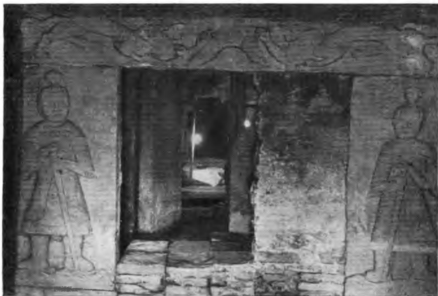
Рис. 8. Рельеф при входе в гробницу Южной Танской династии под Нанкином (X в.)

имело открытие в провинции Ганьсу пещерного буддийского храма Бинлинсы в Юнцзине и пещерного буддийского храма в горе Тяньтишань в Увэе. При обследовании Бинлинсы обнаружено 35 пещер и 87 ниш для статуй Будды, выдолбленных со времени династии Северных Вэй (386—535 гг. н. э.) до Тан. Самая ранняя