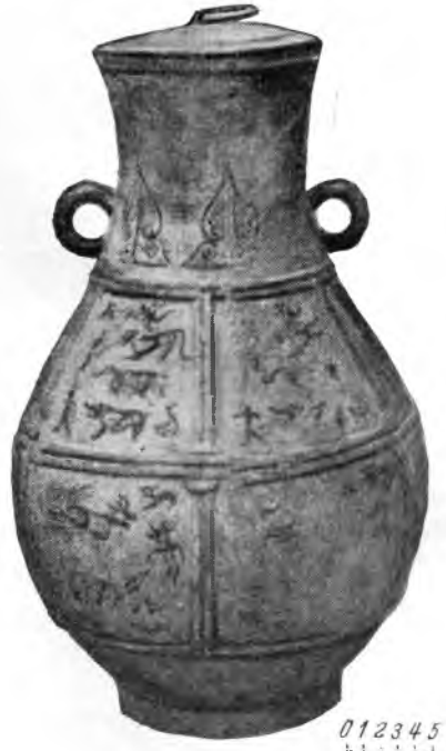
Рис. 6. Бронзовая охотничья фляга «ху», найденная при раскопках в Таншань (IV—III вв. до н. э.)

и скелетами лошадей. Хотя деревянные части колесниц истлели, но сопоставление сохранившихся остатков с описаниями колесниц в письменных источниках позволяет восстановить их первоначальный вид. Эти раскопки проливают новый свет на блестящую культуру начала железного века в Китае 1 . Из могил царства Чу эпохи Чжаньго, раскопанных под Чанша, было извлечено много прекрасных лаковых сосудов, бронзовых мечей, секир и зеркал, деревянных фигурок, глиняных сосудов. Были найдены также картины на шелку и бамбуковые дощечки с надписями. Кроме того, могилы периода Чжаньго были раскопаны в Таншане и Цзяцзячжуане (провинция Хэбэй), в Люлигэ и Чуцзюуне (уезд Хойсянь провинции Хэнань), в селе Дасыкун под Аньяном, в Байша (уезд Юйсянь), в западном предместье Лояна и в южном районе Пекина.