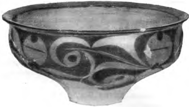
Рис. 1. Неолитический сосуд, найденный в Шэньси недалеко от города Сиань (приблизительно 2000 г. до н. э.)

Неолит. В 1951 г. Институт археологии направил рекогносцировочный отряд в Шэньси и в западную часть Хэнаня. Было открыто несколько новых мест поселения, и в трех местах (в том числе в селе Яншао) были произведены раскопки, показавшие, что в Западной Хэнаня существовала смешанная яншаоско-луншаньская культура. Было открыто более 100 новых пунктов с неолитическими остатками в окрестностях