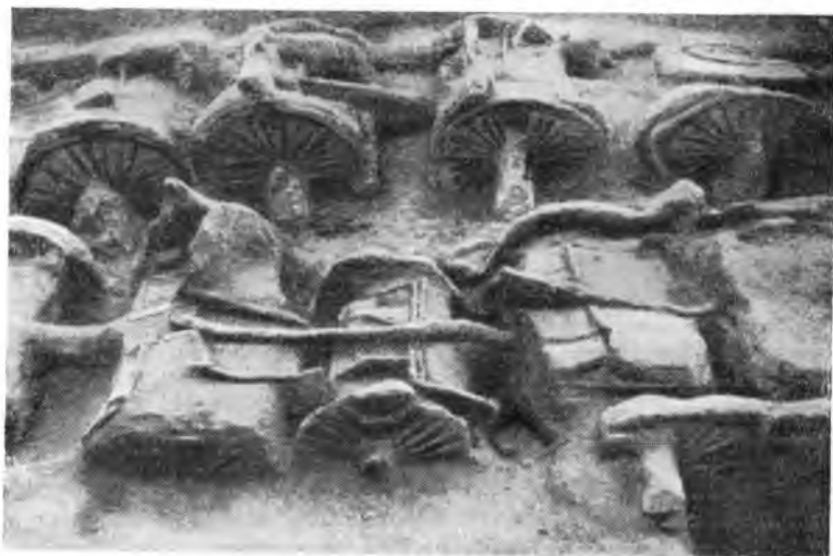
Рис. 4. Обнаруженные при раскопках в уезде Хойсянь остатки колесниц (приблиз. III в. до н. э.)

эпохи Инь были найдены в 1950—1951 гг. в уезде Хойсянь провинции Хэнань, в 1952, в Лояне, в 1953 г. в Чжэнчжоу. Эти находки сделали для нас более ясным распространение иньской культуры. В 1953 г. в селе Дасыкун под Аньяном были найдены предметы, относящиеся к эпохе Инь, а также множество мелких могил и почти нетронутые ямы, в которых были закопаны колесницы с лошадьми. Несколько могил периода