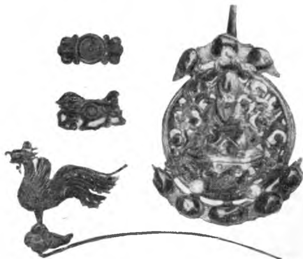
Рис. 9. Золотые пряжки для волос, найденные в западном предместьи Пекина (XVI в.)

надпись сделана в 513 г. Собранный экспедицией материал экспонировался на выставке в Пекине и издан отдельной брошюрой — «Пещерный буддийский храм Бинлинсы» (1953 г.). В 1952—1953 гг. обследовались пещеры в горе Майцзишань у города Тяньшуй (провинция Ганьсу). Значительные результаты дали также раскопки круглых мо-