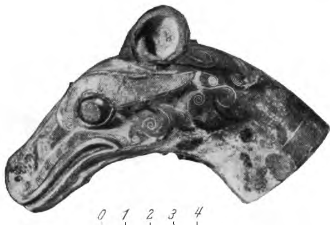
Рис. 3. Найденная в уезде Хойсянь бронзовая голова лошади, инкрустированная золотом и серебром. Эта фигурка представляла собой конец дышла (приблизительно III в. до н. э.)

Культура иньской и чжоуской эпох. Раскопки иньской столицы под Аньяном, осуществленные в 1950 г., дали новые материалы об иньском рабовладельческом обществе. В «Бюллетене археологии Китая», № 5, вышедшем в 1951 г., были полностью опубликованы результаты этих раскопок 1 . Остатки жилищ и могилы