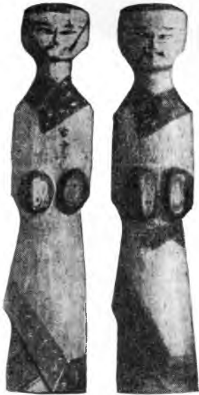
Рис. 5. Деревянные фигурки, найденные при раскопках под Чанша

Западного Чжоу было раскопано в 1953 г. в северо-восточном предместье Лояна. В селе Тайпунунь уезда Цзисянь в провинции Хэнань в 1953 г. было найдено большое количество бронзовой утвари периода Чуньцю (VIII—V вв. до н. э.). Было раскопано сравнительно много могил периода Чжаньго (V—III вв. до н. э.). Довольно крупными по масштабам были раскопки, предпринятые в 1950—1951 гг. в Гувэйцуне, Люлигэ и Чжаогунуне (уезд Хойсянь провинции Хэнань), а также раскопки могил царства Чу, осуществленные в 1951—1952 гг. В уезде Хойсянь было найдено множество предметов из нефрита и бронзы с золотой и серебряной инкрустацией, а также глиняной утвари. Некоторые из находок поражают тонкостью и красотой отделки. Было обнаружено много железных орудий производства; кроме того, была раскопана яма с колесницами