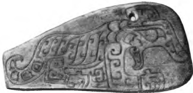
Рис. 2. Каменный гонг, найденный при раскопках иньской гробницы под Аньяном в 1950 г. (XIV — XII вв. до н. э.)

В 1950 г. при раскопках доисторических могильников в Ситуаньшани (провинция Гирин) были найдены ножи, топоры и наконечники стрел из камня, глиняные кувшины,