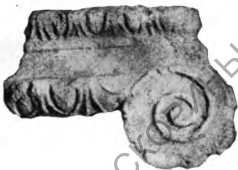
Рис. 3. Часть ионийской капители

образом, двор дома II состоял из двух частей: юго-западная часть являлась откры-