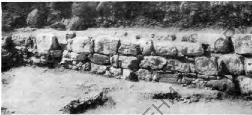
Рис. 2. Стена дома IV

В описываемом квартале находились четыре дома: дома I и II, оказавшиеся под базиликой, открыты в 1952—1953 гг., дом III раскопан в 1949 г., дом IV, занимающий юго-западный сектор квартала, закончен раскопками в 1951 г. Ясный архитектурный облик раскрытых сооружений и обильные находки разнообразных изделий — орудий труда, утвари и т. д. — позволяют составить достаточно полное и подробное представление о жизни обитателей этого квартала Херсонеса в III—II вв. до н. э.