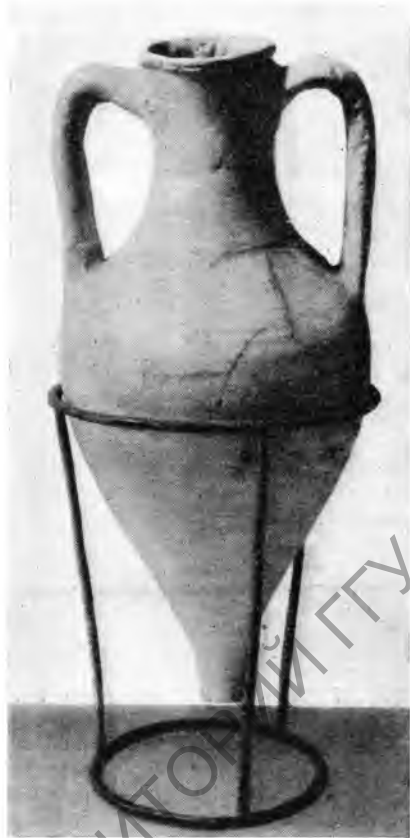
Рис. 8. Херсонесская амфора из дома I (выс. 0,50 м)

Из терракот в домах найдены: маска бородатого Диониса, уже известного в Херсонесе типа 1 , маска Силена с широкой бородой, женский торс, маска Медузы 2 , головка юного сатира с улыбающимся лицом. Неоднократно встречались протомы крылатого гения смерти, из них одна целая с остатками раскраски; протомы гения характерны для Херсонеса и найдены уже во многих экземплярах 3 . Наряду с культовыми терракотами найдены женские обнаженные и драпированные статуэтки, их головки и фрагменты, часть фигурки обнаженного юноши, возможно Геракла, и др.