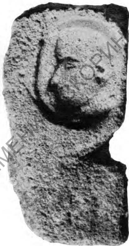
Рис. 6. Форма для отливки медальона из дома II

В Херсонесском музее имеется несколько литейных форм, возможно, добытых при раскопках в дореволюционные годы. Отсутствие точных данных о происхождении этих матриц лишило возможности использовать их в качестве источника по истории херсонесской металлургии. Новые находки не оставляют никаких сомнений в том, что обработка металлов производилась в самом Херсонесе, причем здесь изготовлялись