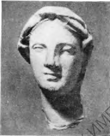
Рис. 10. Отливка по форме терракотты из дома I

После разрушения эллинистических домов XIX квартал в течение длительного времени оставался незастроенным, строительных остатков, восходящих к первым векам нашей эры здесь не оказалось. Лишь в юго-восточной части квартала находилось небольшое, круглое в плане, сооружение, открытое раскопками 1949 г., и остатки двух стен зда-