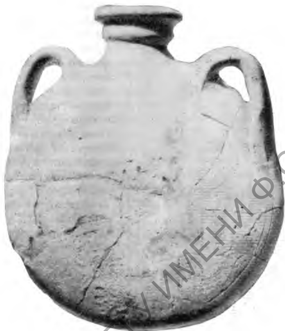
Рис. 9. Фляга из дома I

Редкой находкой, впервые на северном берегу за двадцать лет раскопок, являются две фляжки одинаковой величины (выс. 27 см) и формы, круглые, сплюсненные, с коротким горлом и двумя ручками (рис. 9). Из посуды мелких размеров здесь найдены: