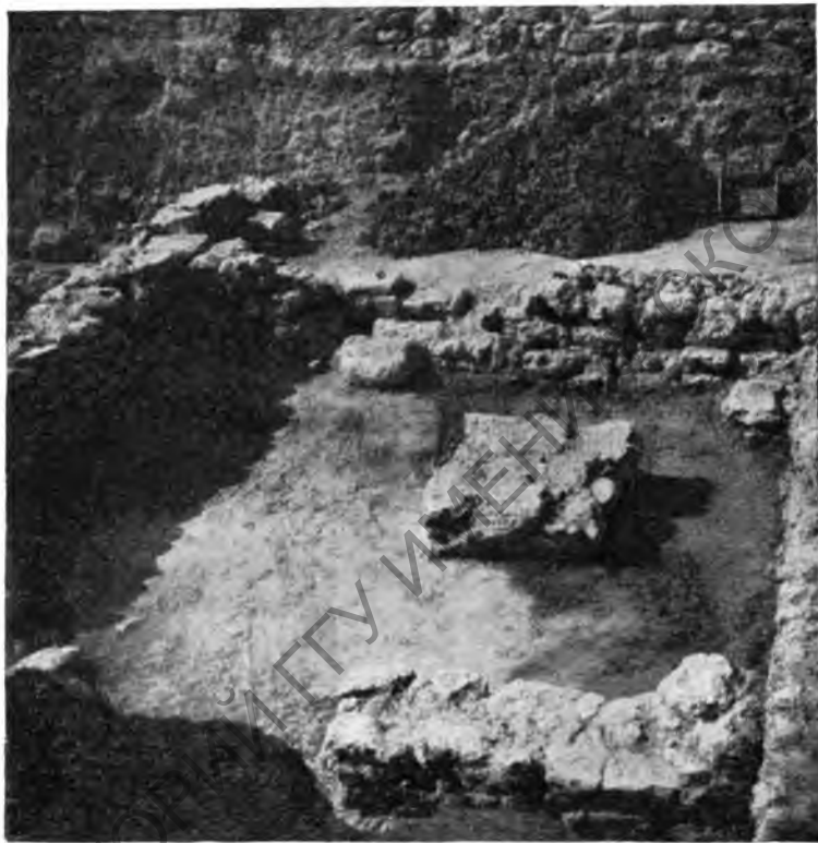
Рис. 5. Алтарь в доме I

В одном из помещений дома II для очага устроена возле стены вымостка из целых черепиц; в доме I очаг находился в углу и его под состоял из мелких обломков черепиц, положенных в два ряда.