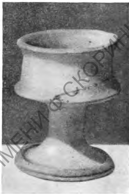
Рис. 7. Жертвенник из дома I

Кроме того были в употреблении жертвенники терракотовые, прямоугольной формы, с плинтусом и карнизом, с углублением сверху для приношений. Карниз жертвенника украшен сухариками, верхняя часть — акротериями на углах, розетками и волютами на боках. На плинтусах отгиснуты овы, на стенках — рельефные изображения. Подобные жертвенники изготовлялись в формах, поэтому совершенно одинаковые экземпляры найдены в разных местах Херсонеса 2 и даже в других городах, например в Ольвии.