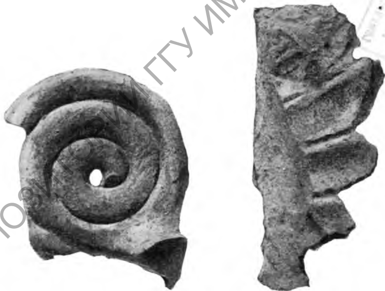
Рис. 4. Фрагменты терракотовых архитектурных украшений

тым двориком, северо-восточная же была простадой и имела портик, поддерживаемый колоннами.