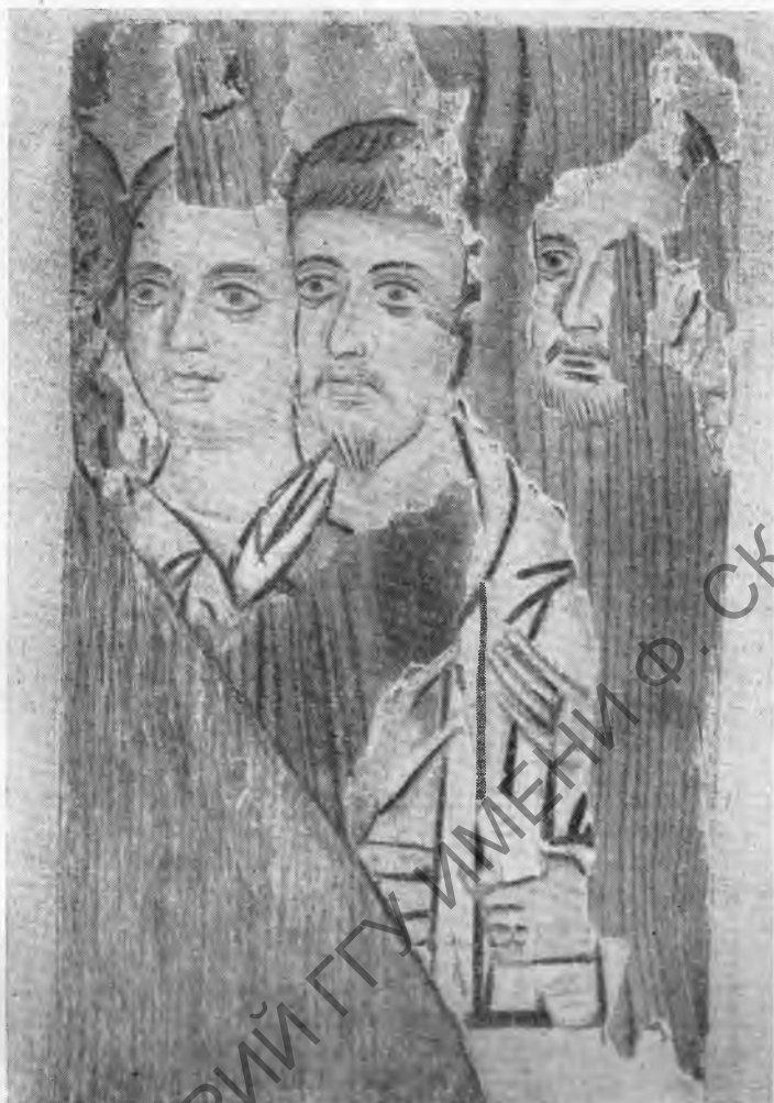
Рис. 9. Фрагмент иконы: три апостола (X—XI вв.)

к этому времени относились тончайшие золотые украшения VI в. — ожерелье из ажурных медальонов, серьги, ожерелье из аметистов, а также пять больших серебряных блюд VII в. — часть клада, найденного в Ламбусе еще в прошлом веке. Блюда эти представлены в кошиях, сделанных в том же материале, что и подлинники. Особенно интересны блюда с рельефными сценами из истории Давида. Бросается в глаза близость этих рельефов к античным прообразам.