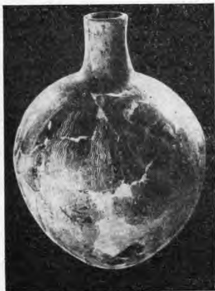
Рис. 1. Сосуд с росписью (вторая половина IV тыс. до н. э.)