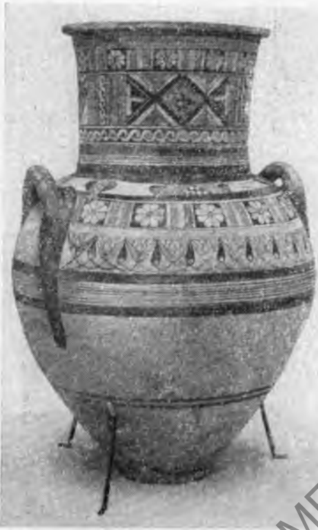
Рис. 5. Амфора полихромного стиля (VII в. до н. э.)