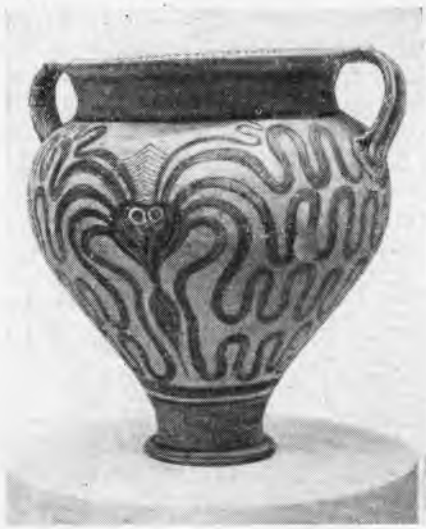
Рис. 3. Амфора с изображением осьминогов (XIV—XIII вв. до н. э.)