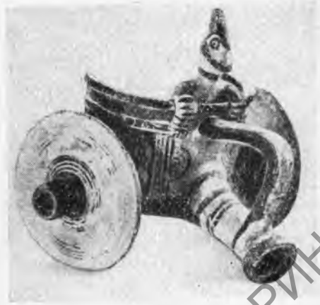
Рис. 6. Возница на колеснице. Терракотовая группа (VII в. до н. э.)