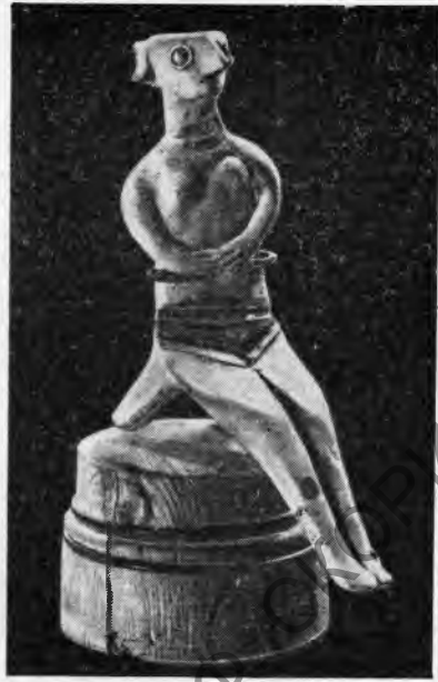
Рис. 4. Сидящая богиня. Терракота (XIV—XIII в. до н. э.)

имевшая форму черпака, была украшена резным орнаментом в виде косых полос и концентрических кругов, вторая — декором в виде ромбов и горизонтальных полос. Эти узоры, заполненные белой пастой, эффектно выделялись на блестящей черной поверхности сосудов.