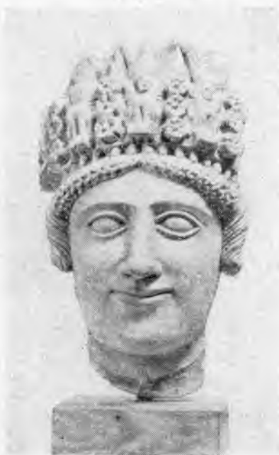
Рис. 7. Голова девушки в диадеме (V в. до н. э.)