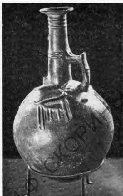
Рис. 2. Сосуд краснополированный (начало II тыс. до н. э.)

небольшими амулетами и крестообразными фигурками идолов, изображающими женское божество. Все они изготовлены из стеатита, за исключением одной фигурки из известняка. В этот период широко распространяется посуда, сделанная из глины. На выставке экспонировались два больших сосуда тыквообразной формы, датирующиеся второй половиной IV тыс. до н. э. Поверхность их украшена росписью, исполненной красной краской в виде широких вертикальных и горизонтальных полос. Поверх росписи нанесен процарапанный «гребенчатый» орнамент.