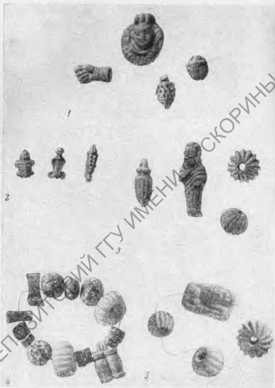
Рис. 1. Фаянсовые подвески и бусины из Тирамбы: 1 — из могилы 33; 2 — из склепа 40; 3 — из некрополя; 4 — из могилы 59; 5 — из могилы 74