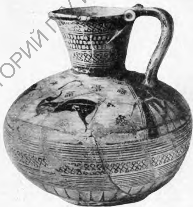
б — родосско-ионийская оинохоя из Лувра.