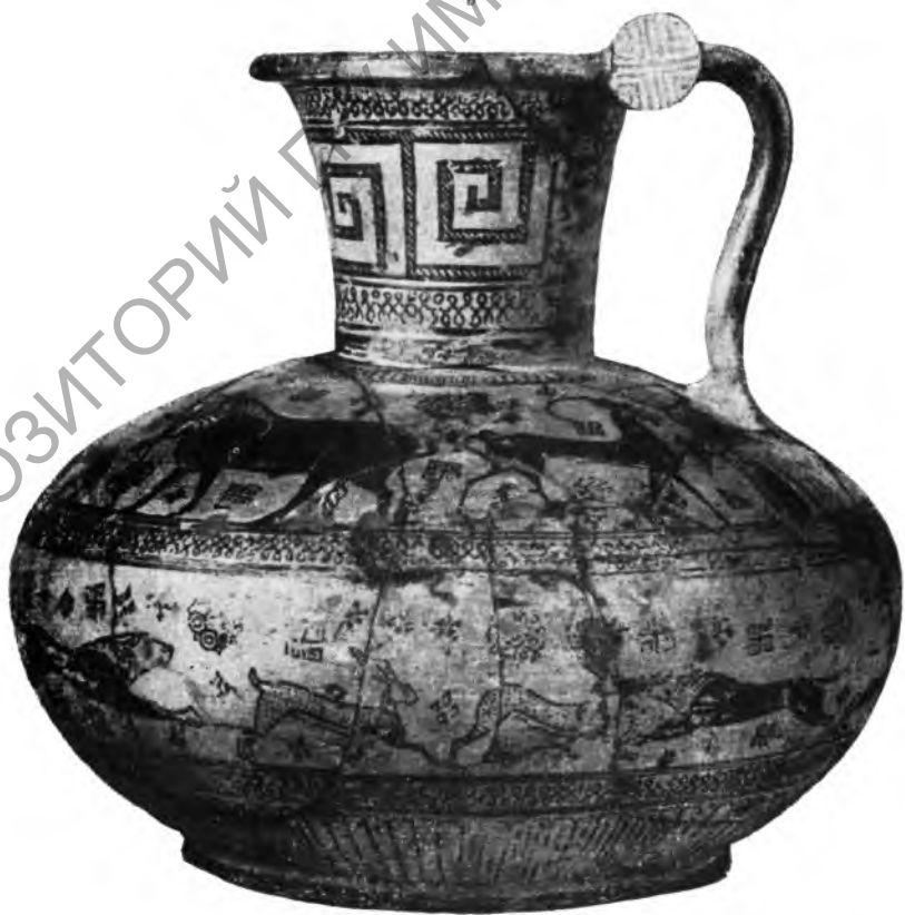
Рис. 1. 2 в, г. Родосско-понийская ойнохоя из кургана Темир Гора (в — вид слева, г — вид справа)