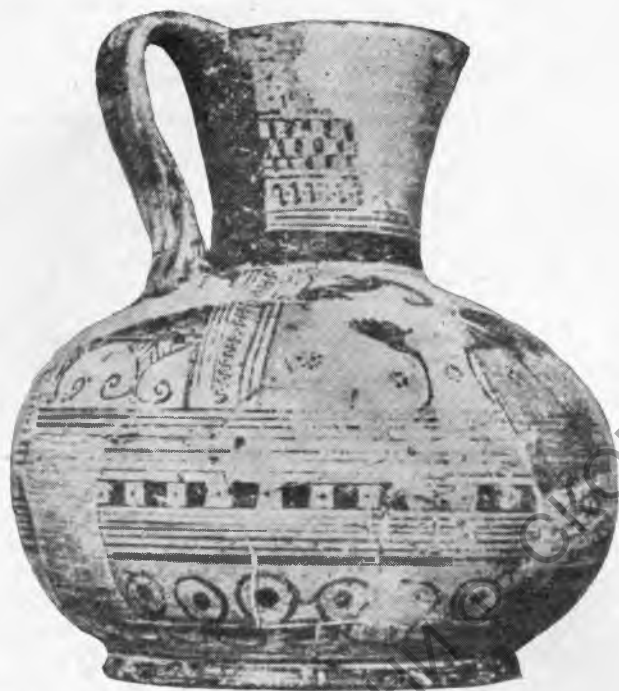
Рис. 2. а — родосско-понтийская оинохоя из Брюсселя;