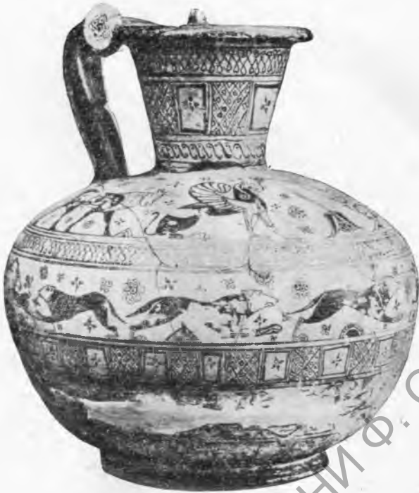
в — родосско-ионийская ойнохоя из Берлина

мнению Ф. Поульсена и Б. В. Фармаковского, был заимствован в ориентализирующий период 40 .