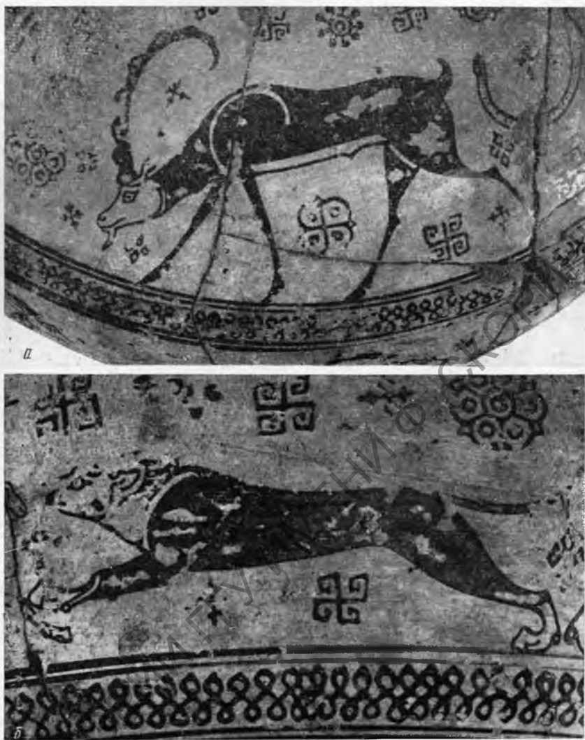
Рис. 3. а — изображение пасущегося козла на ойнохое из кургана Темир Гора; б — изображение бегущей собаки на ойнохое из кургана Темир Гора

ностью, монументальностью и тяжеловесностью, что в какой-то степени лишает роспись впечатления легкости и изящества. Здесь, очевидно, еще чувствуется стилистическое воздействие металлического прототипа. По предположению Акургала, манера покрывать точками тело животного, распространенная в ранней кикладской и вообще в восточногреческой керамике, идет от фригийских и урартских образцов, выполненных в металле 45 . Прототипы могли быть заимствованы также и из древнеиранской то-ревтики 46 . Эта общая зависимость от металлических восточных прототипов вообще очень характерна для ранних образцов родосско-ионийской керамики.