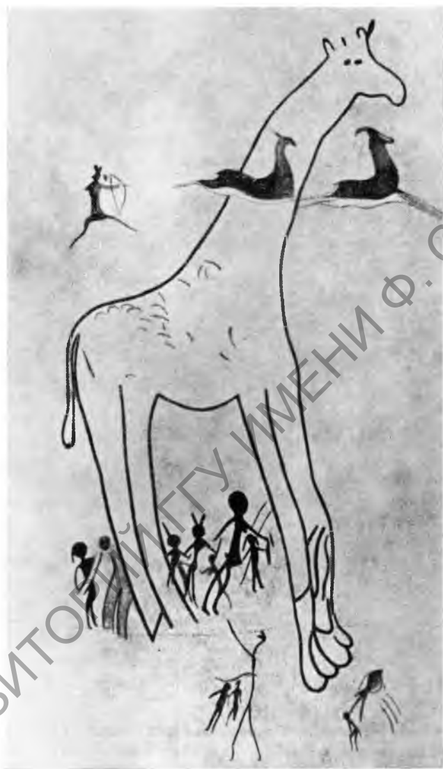
Рис. 1. Наскальная роспись в "Аджефу". Наиболее древний слой — изображение круглоголовых человечков. Второй слой — жирафа; третий, относящийся к пастушескому периоду, — охота на антилоп (высота 1 м 20 см)

Одежда обычно сводится к набедренной повязке с двумя или тремя свешивающимися концами. Характер вооружения различен. Чаще вооружение состоит из палки, лука и копья большого размера (в полтора человеческих роста). Изображения животных довольно редки, среди них можно отметить слона и муфлона. Необычный круглоголовый тип человека очень характерен для первобытной тассилийской живописи;