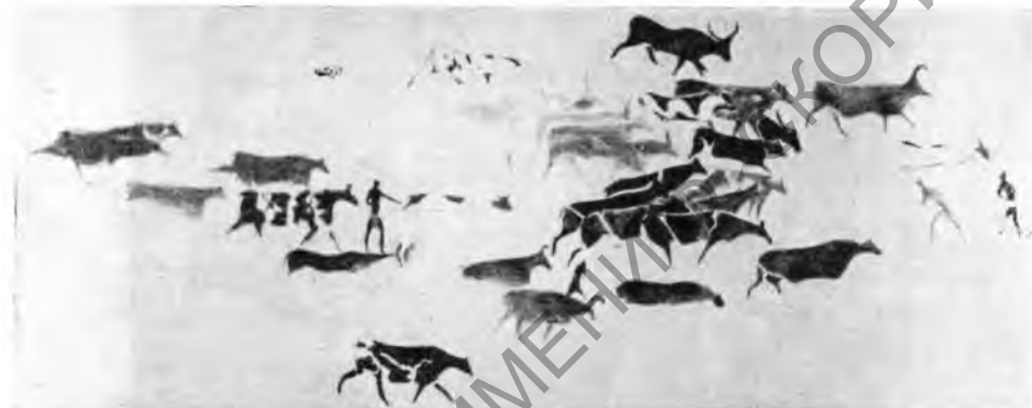
Рис. 4. Полихромная роспись пастушеского периода в Джаббарене (длина 3 м)

Крайне загадочно содержание другой композиции, найденной в Ауанрете. На ней мы видим плывущую женщину с вытянутыми членами и с грудями, изображенными на спине. Она увлекает за собой другую фигуру, согнутую в зародышевом положении. Еще одна появляется из яйцевидного тела, украшенного концентрическими кругами. Принимая во внимание, что эта композиция находится в окружении росписей, отмеченных египетским влиянием, А. Лот высказывает предположение, что ее следует связать с эсхатологическими представлениями древних египтян о загробном путешествии в потустороннем мире.