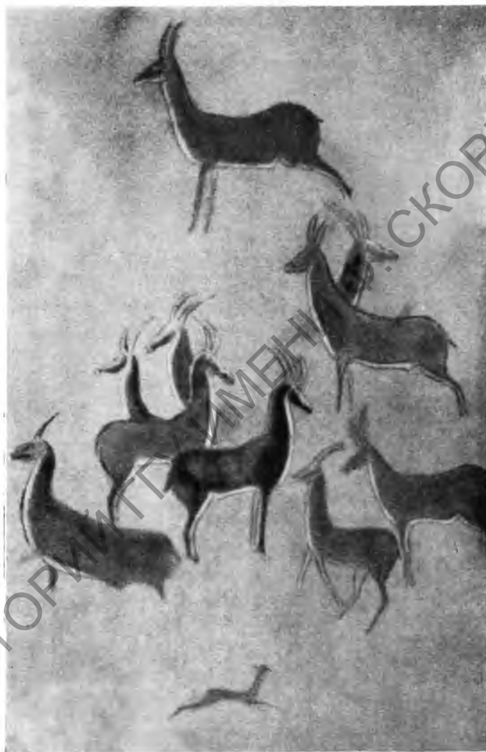
Рис. 6. Роспись в Гамрите. Антилопы. Пастушеский период

обычайная наблюдательность особенно сказывается в мастерской передаче движения и тонкой детализровке форм. Чаще всего встречаются изображения быков, еще не ожиревших на огороженных травянистых настибцах, а перегоняемых по степным просторам. Это прекрасные подвижные животные с гармоничными и легкими формами и длинными