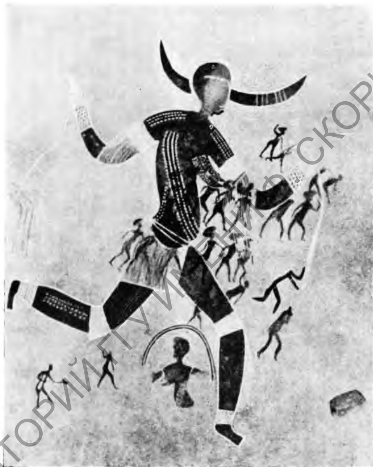
Рис. 2. «Танцовщица» из Ауанрета (высота 1 м 10 см)

С появлением полихромной живописи намечается эволюция. Круглые головы у фигур сохраняются, но туловище уплотняется. Прежняя условность изображения, сводившая человеческую фигуру к нитевидным линиям, постепенно исчезает. Всё же члены