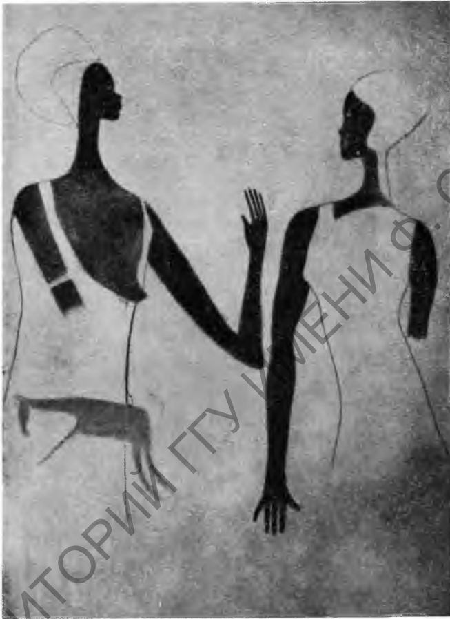
Рис. 5. Наскальное изображение женщин из Джабарена пастушеского периода (высота 1 м 20 см)

Интересно отметить, что сцены предстания почти всегда находятся в крутых высоких убежищах или пещерах со свободным доступом, напоминающих святилища или