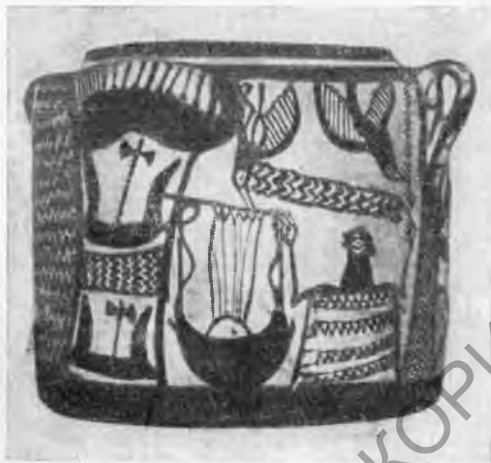
Рис. 12. Крит, Каламион. Пиксида с изображением кифареда позднеминойского III B периода.

В 1967 г. к югу от Αγιος-Κυριλλος в месте, называемом « Ακονακι » 46 , раскопана