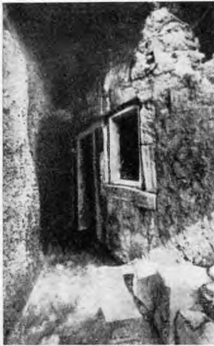
Рис. 7. Тира, Акротири. Стена одного из домов в секторе А

на четыре узких части, со столом для приношений in situ и разбросанными вокруг вазами; его рассматривают как святилище.