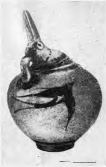
Рис. 3. Тира, Акротири. Прохус с ласточками