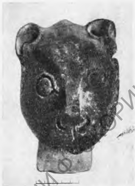
Рис. 6. Тира, Акротири. Ритон в виде львиной головы

и цветами. Особого упоминания заслуживают два кувшина — с ласточками (рис. 3) и колосьями ячменя (минойского происхождения) (рис. 4); миска, тоже с летящими ласточками; этмос, украшенный цветами типа крокуса или лилий, белыми на темном фоне; большой пифос с белыми лилиями на черном фоне (рис. 5) (внутри него оказалась глиняная фигурка) и ритон в виде львиной головы (рис. 6). В одном месте на полу лежали в ряд многочисленные глиняные грузики, упавшие с ткацкого станка, часть которого отпечаталась в вулканической породе. Большой интерес представляет серия свинцовых гирь очень разного веса — от 15 до 737 г; только одна гиря каменная, весом 20,2 г. В 1968 г. путем пробивки туннеля со стороны оврага в секторе А к западу от кладовых открыта стена первого и частично второго этажа дома с хорошо сохранившимися каменными косяками двери и рамой окна (рис. 7). В 1969 г. выявлены другие помещения, причем стену одного из них прорезала терракотовая труба водопровода, а также полностью вскрыт дом, в котором найдена терракотовая расписная ванна и плетеная корзинка (обгоревшая, но восстановленная).