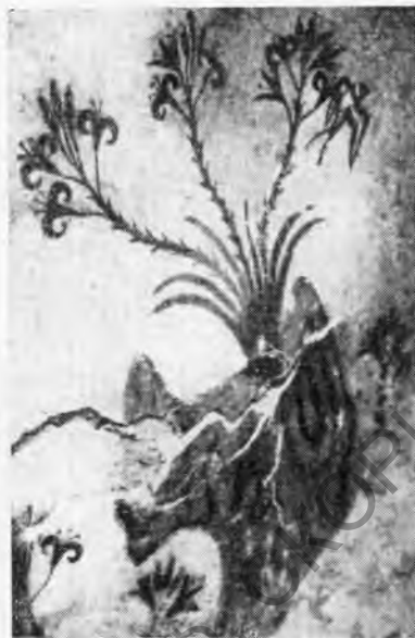
Рис. 9. Тира, Акротири. Часть росписи южной стены «комнаты с лилиями» (сектор Δ)

троне восточноионийского типа, голова Геракла и др. Из результатов работ 1970 г. выделяют группу могил второй четверти VII в. до н. э. и три могилы VI в. до н. э. (в одной был блок с надписью Ἄτταβος).