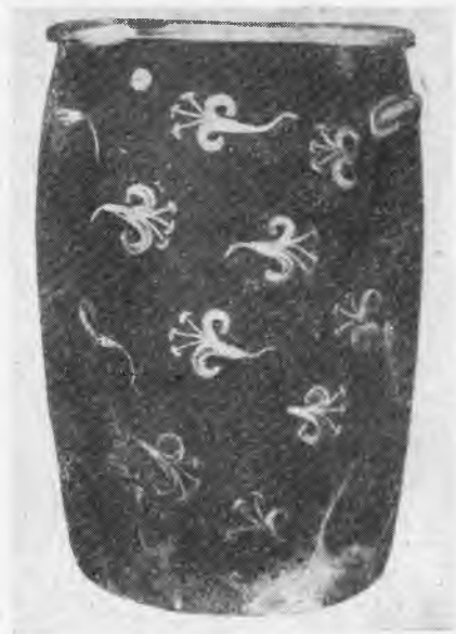
Рис. 5. Тира, Акротири. Пифос с белыми лилиями на темном фоне