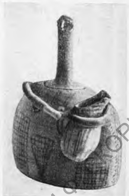
Рис. 13. Крит. Фурну Корифи. Культовая (?) ваза раннеминойского периода

В Матале 53 (Восточный Крит) найдена известняковая база с надписью эллинистического времени — посвященном жрицей Триферой статуи Ἀρτέμιδος Ὀξύβιας, культ которой ранее на Крите не был известен.