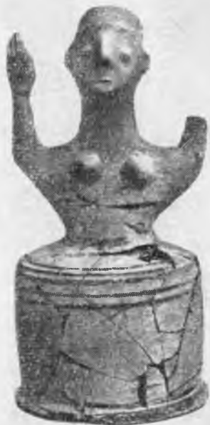
Рис. 10. Крит, Кносс. Глиняная фигурка богини позднеминойского III B периода

(большая часть — раннеминойская I), но без каких-либо следов значительных построек. В 1970 г. под поздненеолитическими слоями открыты четыре лежащих один над другим здания: одно среднего неолита и три ранненеолитического II периода. Все они состоят из маленьких комнат с многочисленными дверями и обнаруживают следы неоднократных переделок. Археологи достигли материка примерно на глубине 8 м, не обнаружив следов докерамического неолита, открытого на Центральном дворе в 1960 г. Кроме того, на Западном дворе в 1970 г. были сделаны еще три зондажа с целью выявить нетронутые отложения, переходные от неолита к раннеминойскому периоду. Однако оказалось, что слои раннеминойского I периода в этом районе были в значительной степени удалены, частично в связи со строительством здания раннеминойского II A периода, найденного в 1969 г., а затем при возведении дворца (не исключено также влияние эрозии почвы). Из других результатов этих зондажей отмечается, что особый интерес представляет одно из отложений позднего неолита, поскольку наряду с обычной керамикой оно дало отдельные черепки, до сих пор в Кноссе не встречавшиеся, но характерные для неолитических отложений под дворцом в Фесте.