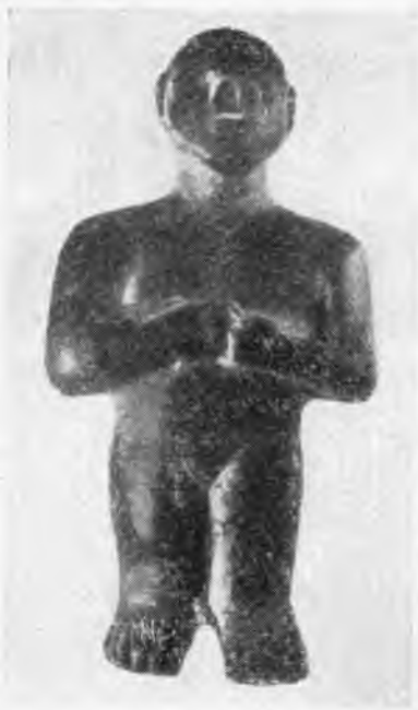
Рис. 11. Крит, Арханы. Каменная фигурка человека раннедворцового периода

расчищена яма, содержавшая большое количество целых и фрагментарных сосудов среднеминойского II — позднеминойского III A периодов, в том числе привозные кикладские, микенские и кипрские вазы, а также глиняные женские фигурки и обломки полихромных фресок. В 1969 г. в восточном углу площади, там, где в 1965 г. были открыты стены позднеминойского I и III B периода, выявлена еще одна стена позднеминойского III B периода и под ней слой конца среднеминойского периода. К западу от района старых раскопок найдена разновременная перемешанная керамика (раннеминойская — VI в. до н. э.), причем преобладает среднеминойская. Четыре зондажа 1970 г. дали среднеминойские слои со стенами и разнообразную керамику — немногие черепки неолита и раннеминойские и много керамики всех фаз позднеминойского III периода, а в одном зондаже обнаружены геометрические сосуды.