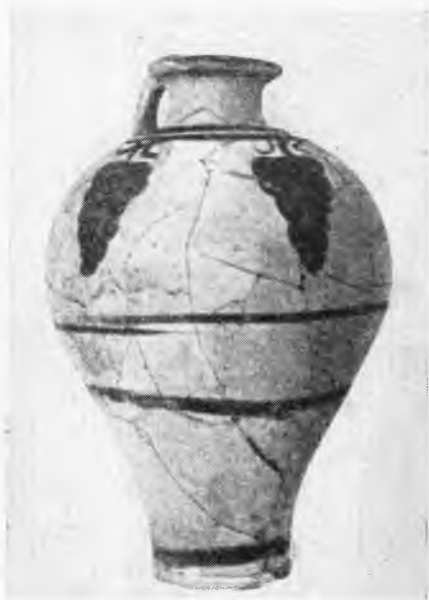
Рис. 8. Тира, Акротири. Прохус с виноградными гроздьями