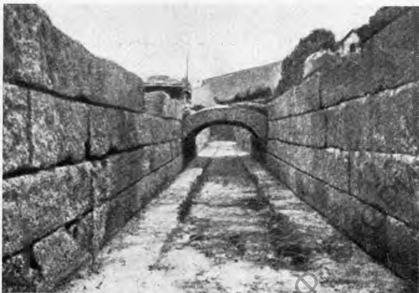
Рис. 1. Родос. Отрезок водоотводного канала с мостом