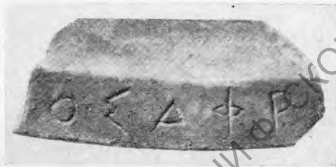
Рис. 4. Фрагмент края мраморного блюда с надписью

В заключение отметим, что кепское граффито представляет самый ранний эпиграфический документ о культе Афродиты в античных городах Северного Причерноморья. Оно иллюстрирует сведения античных авторов и выводы исследователей о том, что культ этой богини играл на Боспоре, и особенно на азиатской его стороне, выдающуюся роль 16 .