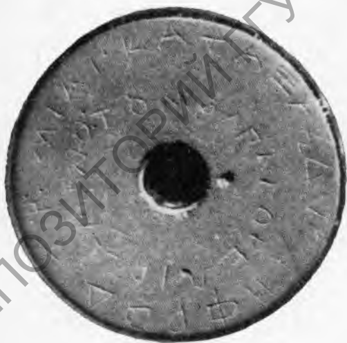
Рис. 1. Ножка килика с граффито

жизни здания длился не очень долго, и, как показывают окружающие материалы, дом перестал существовать около середины V в. до н. э. Находки из тех, что связаны непосредственно с домом, не выходят за пределы VI — первой половины V в. до н. э. Среди этих находок одна обращает на себя особое внимание. Речь идет о ножке чернолакового килика, на нижней плоскости которой начертана надпись (рис. 1, 2). Ножка имеет дисковидную форму; стержень, связывавший ее с корпусом сосуда, тонкий. Глина килика коричнево-оранжевая, очень хорошо отмученная; лак жидкий коричневатого тона, встречающийся на керамических изделиях поийского круга.