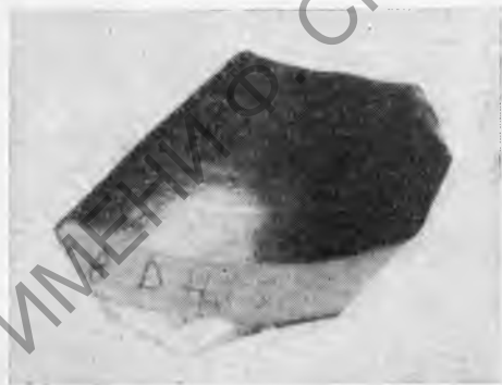
Рис. 3. Фрагмент килика с граффито из ямы VI в. до н. э.

В связи со сказанным выше считаем нелишним привести фрагмент аттического килика, близкого типу мелкофигурных киликов, найденный в том же году, что и донце килика с граффито. Фрагмент обнаружен на том же участке, в яме, заключавшей материал третьей четверти VI в. до н. э. На фрагменте сохранилась часть граффито — ...εδγῖο (рис. 3), видимо представляющее имя в родительном падеже с окончанием на -ο. Обращает на себя внимание архаическое начертание эпсилона и характерный ионизм η = ε. Вряд ли следует сомневаться в вотивном значении надписи; в таком случае этот килик, вероятно, также был связан с располагавшимся здесь святилищем Афродиты.