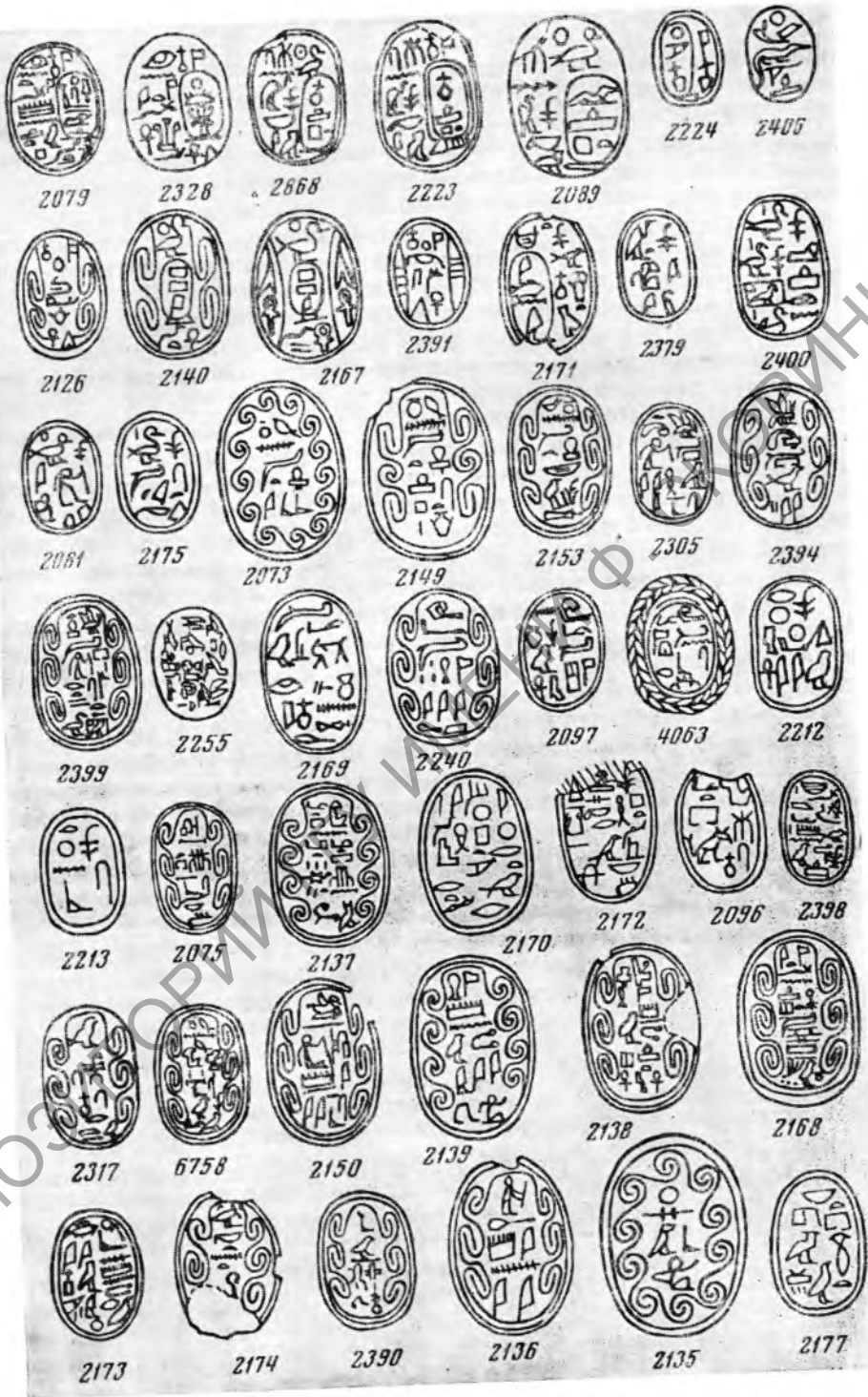
Таблица V. Прорисовки скарабеев из Собрания ГМИИ (скарабеи из Собрания Эрмитажа даны в таблицах фотографий).