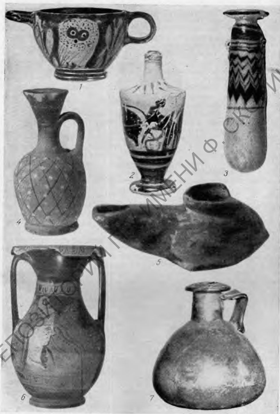
Рис. 2. Сосуды из Новороссийского музея: 1 — краснофигурная котла, 2 — чернофигурный лекиф, 3 — стеклянный алабастр, 4 — сетчатый лекиф, 5 — сероглиняный светильник, 6 — краснофигурная пеллика, 7 — стеклянный сосуд