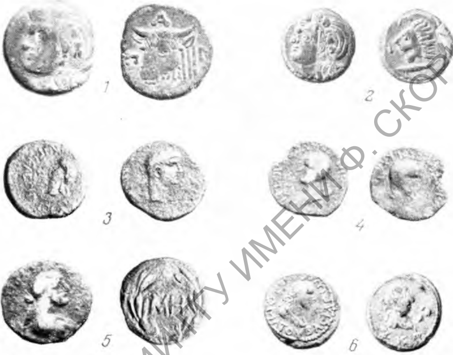
Рис. 3. Монеты, найденные на территории Новороссійска