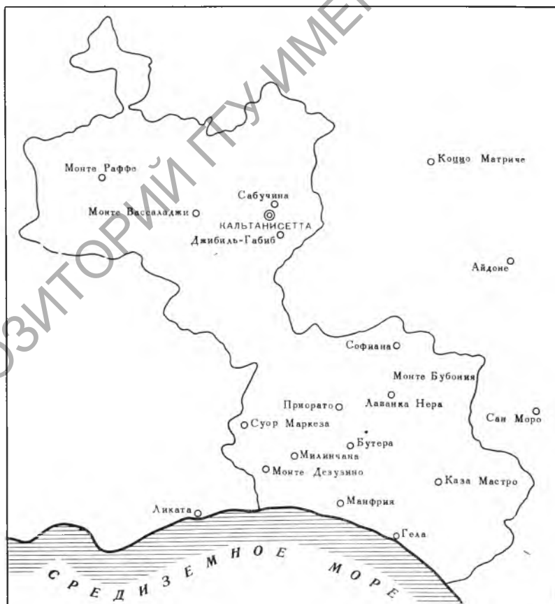
Рис. 2. Район археологического исследования ввнутренней территории Гелы (по Д. Адаместеану)