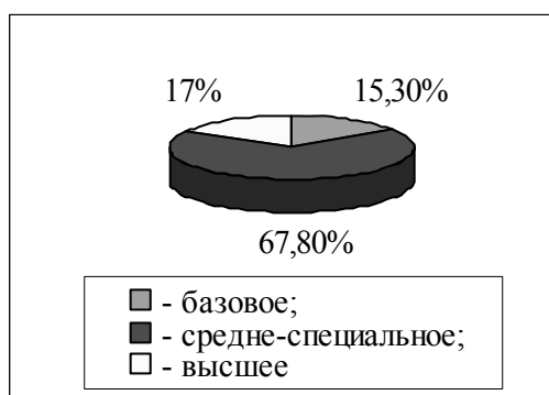
Рисунок 1 – Образование кандидатов в приемные родители

период с 2008 по 2010 гг. В исследовании были получены данные о том, что кандидатами в приемные родители в подавляющем большинстве случаев являются женщины. Средний возраст кандидата в приемные родители составил 41,4 года. Около 35–37% кандидатов в приемные родители – это лица, моложе 40 лет. Средний возраст собственных детей кандидатов в приемные родители составил 16,2 года. У 30% кандидатов в приемные родители нет собственных детей. На момент заключения договора о создании приемной семьи большинство кандидатов в приемные родители имели среднее специальное образование (рисунок 1). Около половины кандидатов в приемные родители на момент создания приемной семьи не имели постоянного места работы (рисунок 2).