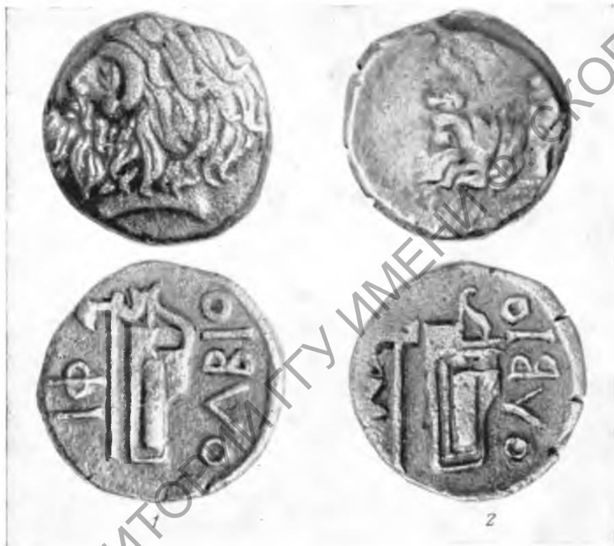
Рис. 2. Ольвийские «борисфены» из виллы № 3 поселения Чертоватое II (увеличено в два раза)

Вклейка к статье В. В. Рубана, В. Н. Урсалова