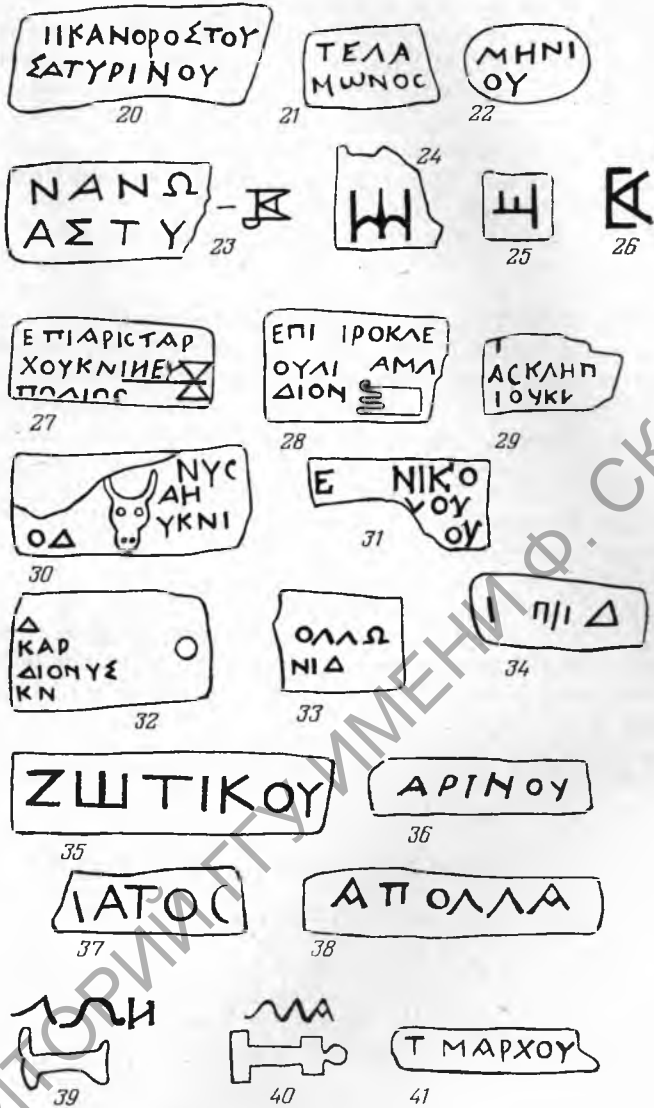
Рис. 2. Херсонесские клейма Неаполя Скифского, 20—26; клейма Книда 27—34; клейма Коса 35—40; клеймо Герак- леи Повтийской — 41

вой половине II в. до н. э. 15 Клеймо фабриканта Асклепиодора (рис. 2, 29) имеет аналогии в каталоге Е. Придика 16 и А. Дюмона 17 , его же приводят В. Грейс и М. Савватиану-Петропулаку, датируя концом II в. до н. э. 18 Клеймо с именем эпонима Дионисия (рис. 2, 30) относится к концу