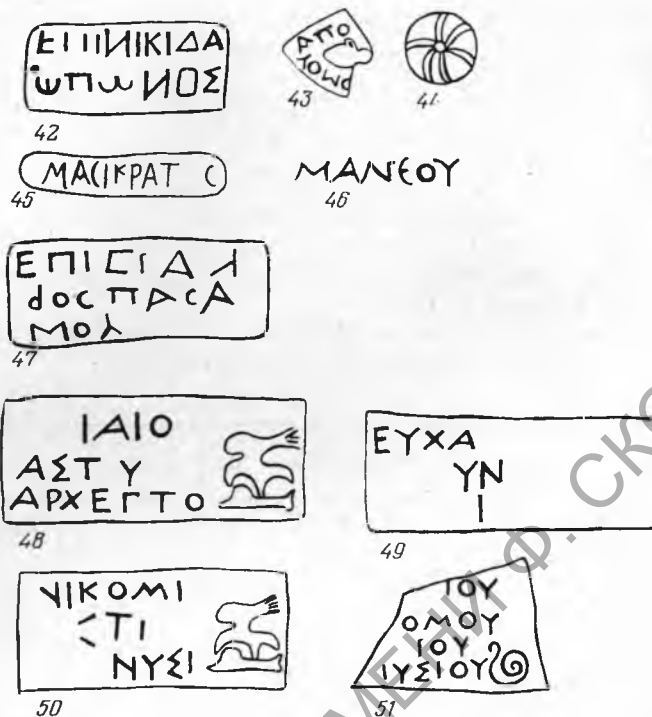
Рис. 3. Клейма Неаполя Скифского из неизвестных центров 42—47; клейма на синопской гепериде 48—51

ского (360—320 гг.) 27 . Из них 6 клейм имели эмблему — орел, терзающий дельфина; на двух клеймах (с именами астинома Гистиэя и фабриканта Посейдония и с именем астинома Никомеда при фабриканте Невмении) эмблема не сохранилась, возможно, здесь также был орел, терзающий дельфина. На одном из указанных клейм эмблема — колос пшеницы вправо и одно клеймо без эмблемы. Из 10 частично сохранившихся и не поддающихся чтению клейм на трех эмблема — орел, терзающий дельфина. Таким образом, I группа синопских клейм (IV в. до н. э.) представлена на Неаполе наибольшим количеством экземпляров (13, а возможно, и больше экземпляров из 28). 320—270 гг. (II группа) датируются клейма с именами астиномов Аполлодора, Евхариста (2), Протофана и фабриканта Гикесия. 270—220 гг. (III группа) датируются 2 клейма с именами астиномов Посейдония и Поликтора; одно клеймо с именем Клевмена относится к 180—150 гг. (V группа).