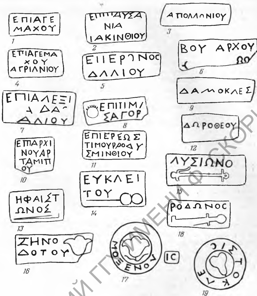
Рис. 1. Родосские клейма Неаполя Скифского

нию, имя не читается) имеет дополнительный штемпель с буквой Α (см. приложение № 56). Это редкий случай, так как обычно дополнительные клейма при прямоугольных штемпелях не встречаются. Д. Б. Шелов считает, что М. Нильсон ошибочно упомянул о дополнительном клейме при прямоугольном с именем Тимагора 7 . Среди имен фабрикантов четыре раза встречено имя Тимоксена, причем два круглых клейма с этим именем имеют дополнительные штемпеля: Ο и ΙC (рис. 1, 17). В последней своей работе Д. Б. Шелов признает бытование дополнительного клеймения с конца III и весь II в. до н. э. 8 Трижды встречено имя Родона.