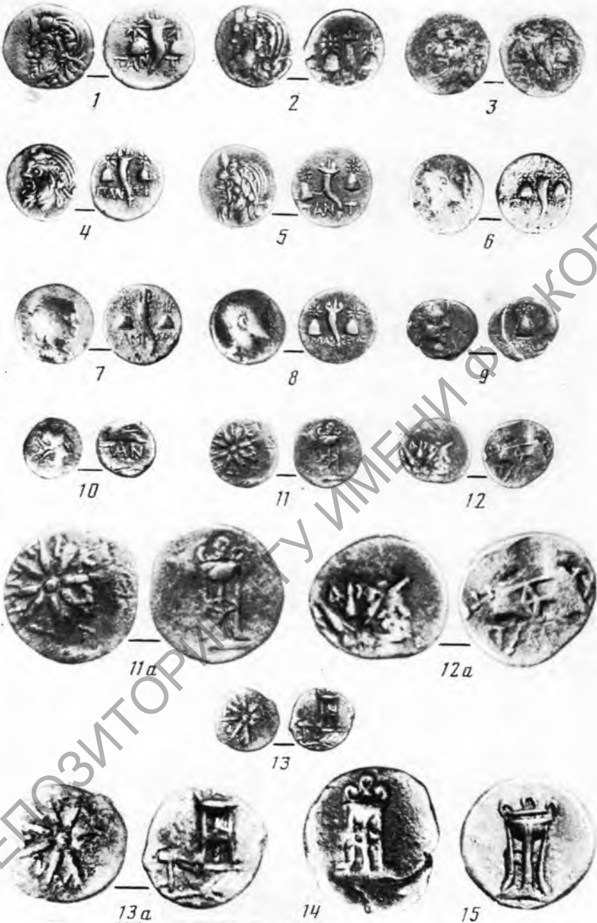
Таблица I. 1—5, 9—15 — медные монеты Пантикапея (11а, 12а, 13а, 14, 15 — увеличены); 6—8 — медные монеты Синопы, Амиса, Амасеи