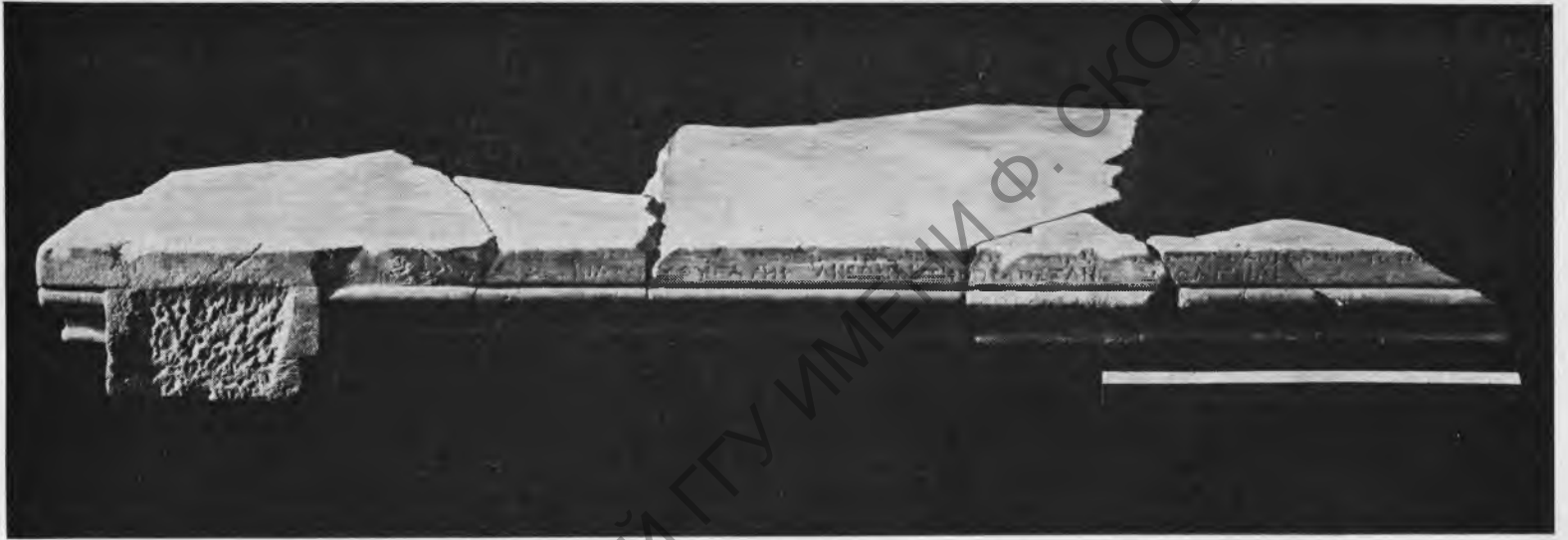
Рис. 1. Надпись дочери царя Скилура из Пантикапея