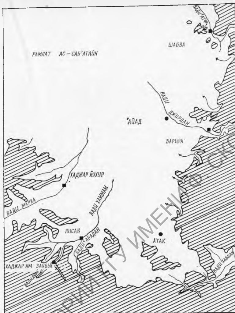
Рис. 1. Карта области Шабва

На многих городищах по краю пустыни отмечаются скопления обожженных камней и рядом — обработанные каменные изделия (главным образом кремневая индустрия): скребки, бифасы из кварца, пластинки и нуклеусы из обсидиана. Обнаружены два очага, одному из которых 5330 \pm 70 , а другому — 4800 \pm 400 лет.