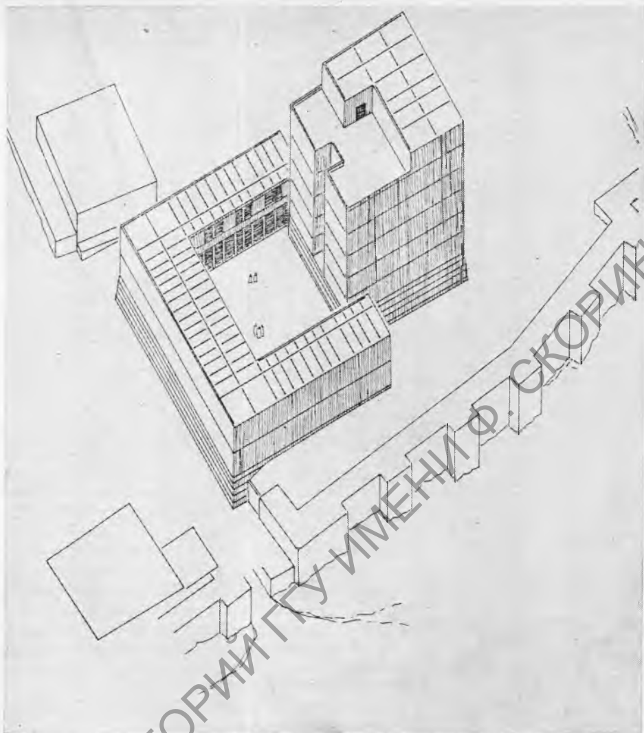
Рис. 2. Гипотетическая реконструкция «царского дворца» в Шабве (Ж. Сэнь)

дворец, судя по всему, похож на химьяритские замки, описание которых мы находим у ал-Хасана ал-Хамдани (X в. н. э.); он писал о массивных домах-башнях, которые располагали собственными средствами защиты и в то же время могли быть легко уничтожены огнем.