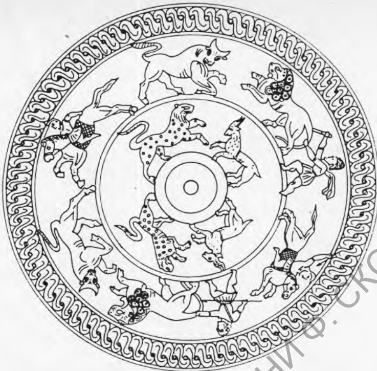
Рис. 4. Дно ковша, украшенное орнаментом и изображениями двух сцен охоты

документирован фрагментом греческой чаши со штампованным орнаментом (здание № 34). Что касается влияния ахеменидской глиптики на местные печати, оно подробно исследовано в диссертации Л. А. Акила (Парижский Университет 1). Отметим, что в Шабве не обнаружены монеты, имитирующие афинские драхмы.