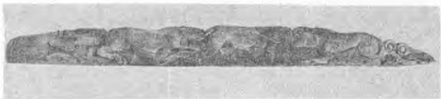
Рис. 3. Деревянная часть колчана из женского погребения

ревянная основа которой также покрыта золотой фольгой. У шеи найдены 14 шерстяных витых шнурков красного цвета с «балабошками» на концах, нанизанных на нитку по семь штук. Сохранились войлочные части верхней одежды с аппликацией и мех. На поясе — две парные деревянные пряжки, покрытые золотой фольгой с изображением барсов (рис. 2) и еще несколько меньших по размеру пряжек с резным орнаментом, а также деревянный гребень, край которого оформлен фестонами. Вдоль правой ноги лежал боевым концом вверх железный чекан с длинной деревянной ручкой и железным втоком, а вдоль левого бедра — деревянная часть несохранившегося колчана. На правом бедре был железный кинжал очень плохой сохранности в деревянных ножнах. Рядом обнаружены пять костяных наконечников стрел с древками, а также части сложносоставного лука. На погребенном были красные длинные штаны из плотной шерстяной ткани, войлочная обувь очень плохой сохранности, отделанная сверху мехом и широкой красной тесьмой.