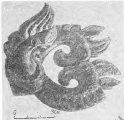
Рис. 4—5. Грифоны. Украшения конской упряжи

ем, положение умерших в колодах, а также поясной набор мужчины с пряжками, изображающими хищников, и деревянная основа колчана со сценой терзания в погребении женщины. Ни в одном из исследованных рядовых погребений эта категория предметов не была украшена фигурками животных 4 , вероятно, это было возможно только для лиц более высокого социального статуса. Мужчина и женщина, захороненные в кургане на Ак-Алахе, судя по погребальному обряду, скорее всего были равны по своему общественному положению. Личные вещи, сопровождающие их, — это главным образом предметы вооружения. Нет престижных импортных изделий (за исключением 34 раковин каури), литых золотых или серебряных украшений.