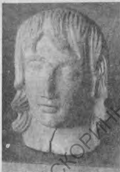
Рис. 3. Женская голова. Грессето. Археологический музей. Маремми

Основанный в 1823 г. Археологический музей г. Ареццо носит имя Мецената, принадлежавшего к древнему арретинскому роду Цильриев. Из экспонатов музея наибольший интерес представляет коллекция бронзовых статуэток из раскопок Дж. Гаммури-ни в 1863 г. архаического некрополя Поджо дель Соле к западу от города. Статуэтки были изготовлены в местных мастерских и относятся к V в. до н. э. 14 Перед нами изображения обнаженных мужчин и женщин с плотно прижатыми к бедрам руками (иногда женщины в плащах с кашпоном), служившие вотивными дарами. Музей Ареццо, естественно, богат знаменитой арретинской керамикой середины I в. до н. э. — середины I в. н. э., нередко с именами владельцев сосудов (Аттей, Перенний, Расиний, Анний, Корнелий и др.). Интересны также мужской каменный торс V в. до н. э., происходящий из Марциано, мраморный алтарь эпохи Августа, украшенный рельефным изображением на сюжеты возникновения Рима, мраморный бюст Агриппы.