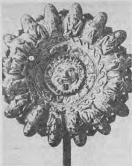
Рис. 2. Бронзовый светильник. Музей этрусской академии. Кортона