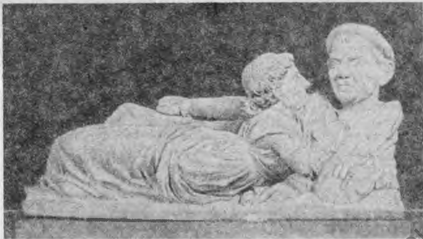
Рис. 1. Крышка погребальной урны из Вольтерры. Вольтерра. Музей Гуарначчи

людю религиозных представлений и художественных форм на протяжении ряда столетий. Урны IV в. до н. э. из туфа имеют крышку в виде человеческой головы, реже — фигуры уснувшего с патерой или диптихом в руках (рис. 1). Их стенки украшены рельефными изображениями демонов смерти, фантастических животных, морских чудовищ. Встречаются изображения сцен погребения с участием демонов и родственников покойного. На стенках урн середины III в. до н. э. наряду со сценами путешествия в загробный мир на коне или на лодке часты мифологические сюжеты, связанные с гибелью героев или трагическими превращениями судьбы: похищение Персефоны, убийства Клитемистры, Троила. Изображения на оссуариях II в. до н. э. — I в. н. э. еще более драматичны 10 . А. Маджани удалось выявить принадлежность ряда урн музея Вольтерры (инв. № 621, 227, 158) мастерской этого города, работавшей в I в. до н. э. в послесулланское время 11 .