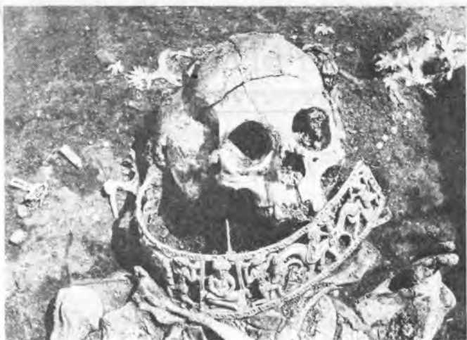
Рис. 1. Погребение в кургане 10 Кобяковского могильника. Деталь