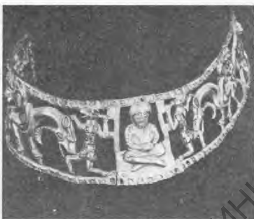
Рис. 6. Гривна. Центральная часть