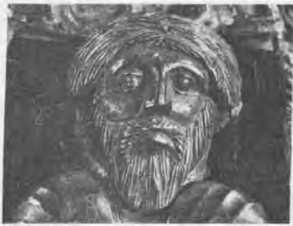
Рис. 9. Гривна. Деталь