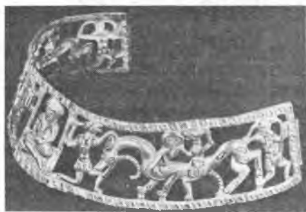
Рис. 7. Гривна. Вид сбоку