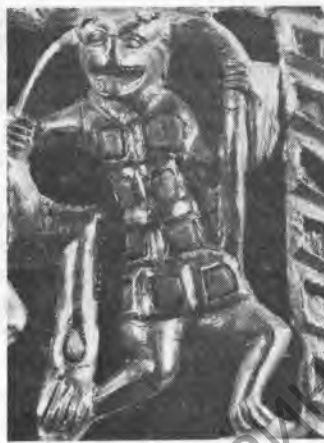
Рис. 13. Гривна. Деталь

в передне- и среднеазиатском регионах около рубежа нашей эры: бактрийское зеркало из Соколовой могилы с ручкой в виде мужской фигуры с ритонном 17 , фигурки «музыкантов» из Тилля-Тепе 18 , оссуарий с фигурой воина из Кой-Крылган Калы 19 .