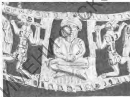
Рис. 8. Гривна. Деталь

двучленная соединенная шарнирным замком золотая гривна, инкрустированная бирюзой (рис. 1, 4—13). Украшение выполнено в технике чеканки с подработкой резцом. Фриз гривны содержит сюжетную композицию, построенную по геральдической схеме. В центре ее находится мужской персонаж — бог или герой, сидящий на коврик, скрестивши ноги «по-восточному». У него густая шапка разделенных на пряди волос, усы и борода. Лицо персонажа широкоскулое, европеоидное (рис. 9). Нос плавно изогнут, с широкими крыльями. Округлые выпуклые глаза широко открыты; губы плотно сжаты. Одет герой в кафтан с глубоким вырезом на груди, сборенными рукавами; узкие штаны заправлены в сапоги с застежками. В руках он держит кубок, на коленях в ножнах лежит меч. Меч героя имеет средние размеры (рис. 10). Однако не исключено, что его длина ограничена вследствие стремления мастера вписать оружие в контуры фигуры. Рукоять меча имеет подтреугольное навершие. Перекрестие не проработано, но не исключено, что оно «утоплено» в ножнах. Ножны оформлены тремя продольными желобками. Ближе к рукояти на ножнах помещена уплощенная прямоугольная площадка, очевидно, воспроизводящая скобу из камня или металла. По обе стороны от центрального персонажа, как бы на заднем плане, в перспективе, двумя вертикальными полосками с имитацией «косички» обозначен проем, образующий в сочетании с ковриком, на котором находится герой, некое подобие трона.