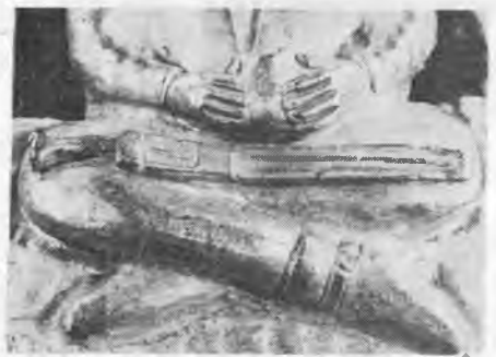
Рис. 10. Гривна. Деталь

морфными существами, вооруженными палицами и одетыми в стилизованный пластинчатый доспех. Одно из таких существ, став на правое колено (левое пытается укусить дракон) и схватив левой рукой загривок чудовища, замахивается правой рукой с зажатой в ней палицей (рис. 11). Другое существо, оседлав дракона и схватив его за крыло, пытается нанести ему удар аналогичным предметом (рис. 12). Третья фигура, расположенная анфас, держит дракона за хвост (рис. 13).