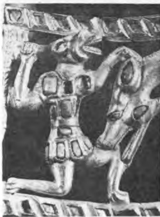
Рис. 11. Гривна. Деталь