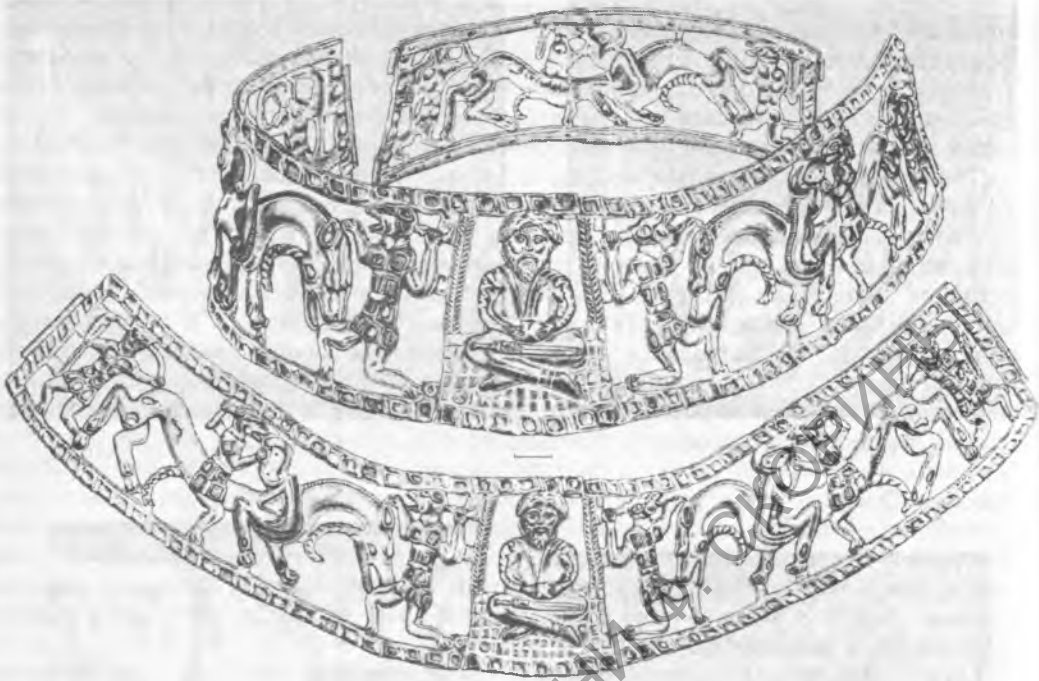
Рис. 4. Гривна: а — общий вид; б — развёртка (рисунок автора)

кобьяковской диадемы, может быть выражена как 4:12:6. Интересно, что подобное соотношение является достаточно устойчивым для схемы типа «птицы у древа жизни» и зафиксировано в фольклоре: «Стоит дуб о двенадцати ветвях, на каждой ветке по четыре гнезда, в каждом гнезде по шесть простых яиц, а седьмое красное» 11 . Показательно, что число семь в приведенном выше тексте фигурирует как производное от шести, что характерно и для образования числа пять в мифопоэтической и изобразительной традиции и связано с принципом зеркальной симметрии схем мироздания (ср.: шесть оленей плюс древо, четыре птицы на ветвях плюс одна на вершине). Подобный числовой код имеет следующую символику. Число семь характеризует саму идею вселенной, четыре — образует статичную целостность и равно сторонам света, двенадцать — имеет зодиакальный смысл, пять — одна из характеристик макро- и микрокосма (четыре стороны света плюс центр) 12 .