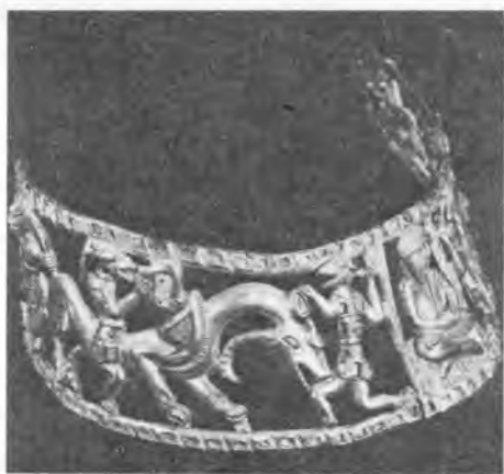
Рис. 5. Гривна. Вид сбоку