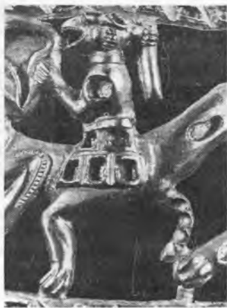
Рис. 12. Гривна. Деталь