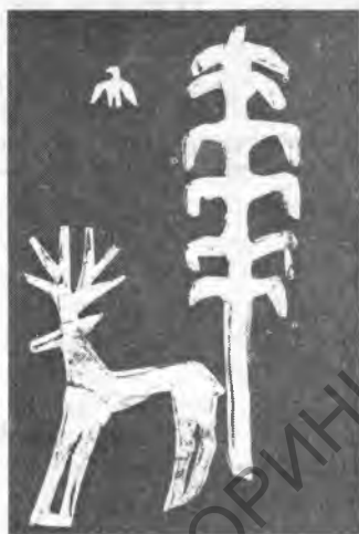
Рис. 2. Детали аппликации диадемы

фигурок оленей, показанных в позе «внезапной остановки», четыре фигурки орлов в геральдических позах, плоские округлые диски (рис. 1—2).