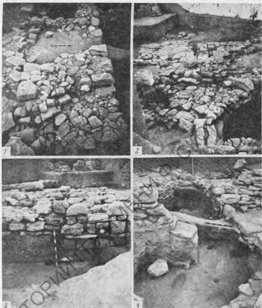
Рис. 2. 1 — оборонительная стена. Вид с востока; 2 — оборонительная стена и остатки наземных построек. Вид с северо-востока; 3 — часть фундамента оборонительной стены; 4 — оборонительная стена и полуземлянки VI и VII. Вид с запада

(раскопочный участок Р) в сезоне 1982 г. и затем стала одним из основных объектов исследований Мирмекийского отряда Боспорской экспедиции ЛОИ АН СССР в 1983, 1984 и частично 1986 г. За это время был открыт участок стены длиной около 12 м с ориентацией по линии восток—запад (рис. 1, 2). Ширина ее составляет 3—3,2 м, высота вместе с фундаментом достигает 0,8 м. Незначительная сохранность стены в высоту объясняется выборкой камня кладки (очевидно, неоднократно), в результате которой от стены осталось практически одно основание. Траншея выборки прекрасно читается в разрезах культурных напластований участка.