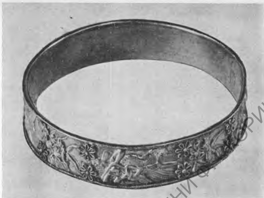
Рис. 4. Замкнутый золотой декорированный пластинчатый браслет

не имеют здесь никакого функционального значения. Такие отверстия обычно делаются для набивки или нашивки украшения, но не для напайки. Следует отметить также, что прием накладки декоративного украшения на гладкую основу пластинчатого браслета вообще встречается крайне редко. В данном случае сам набор пластин, составляющих композицию из трех фигур, говорит о том, что он мог быть бесконечен. Именно поэтому третья группа в каждом фризе обрывается на одной поместившейся здесь фигуре грифона. Так что сами браслеты могли быть изготовлены несколько позднее.