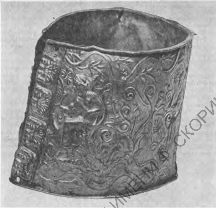
Рис. 7. Золотое пластинчатое декорированное украшение

подробнейший стилистический экскурс на темы данных сюжетов, отметила также явную связь изображений на браслете с известными тогда уже мелосскими терракотовыми рельефами, и датировала браслет второй четвертью V в. до н.э.