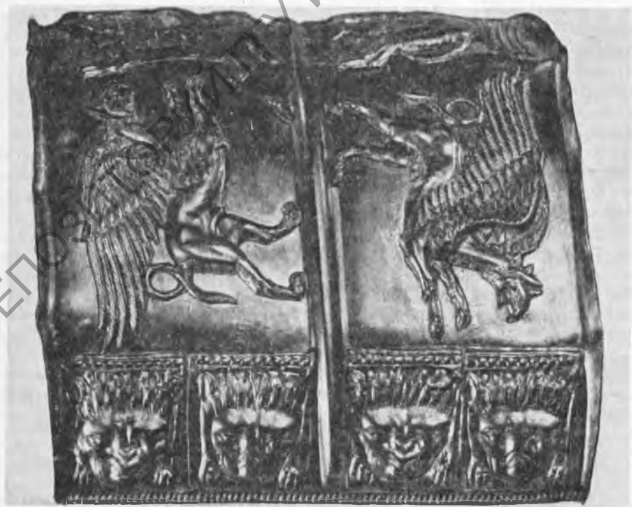
Рис. 2, 3. Фрагменты золотого декорированного пластинчатого браслета