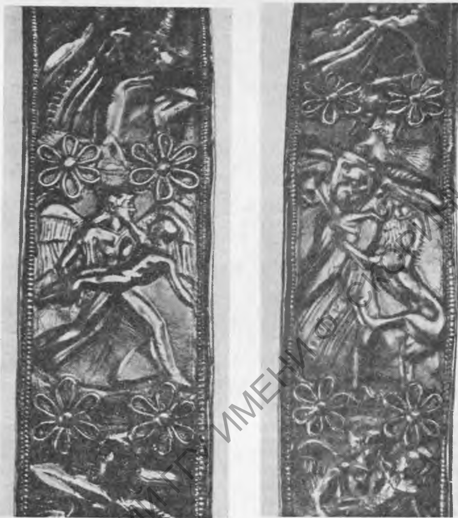
Рис. 5, 6. Детали того же браслета

Причерноморье, а также в самой Греции. Эти аналогии, или, точнее, сходные мотивы скорее можно найти в вазовой росписи конца VI—V в. до н.э. 22 Особенно выразительны эти сюжеты на терракотовых мелосских рельефах из некрополя Камироза второй четверти V в. до н.э. 23