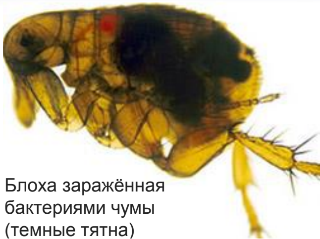
Блоха заражённая бактериями чумы (темные тятна)