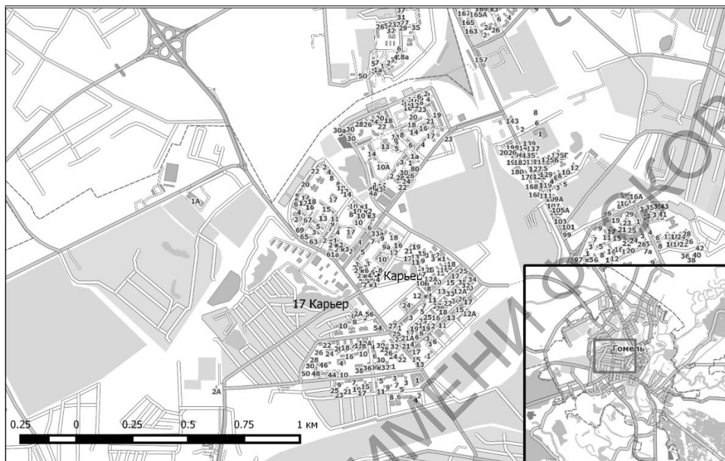
Рисунок 4. – Каскад Сельмашевских и Брилевских озер

Озеро Бурое болото (Волотовской канал) – вытянутое озеро в форме рогатки к западу от Волотовского каскада озер в Железнодорожном районе Гомеля. Используется горожанами для отдыха.