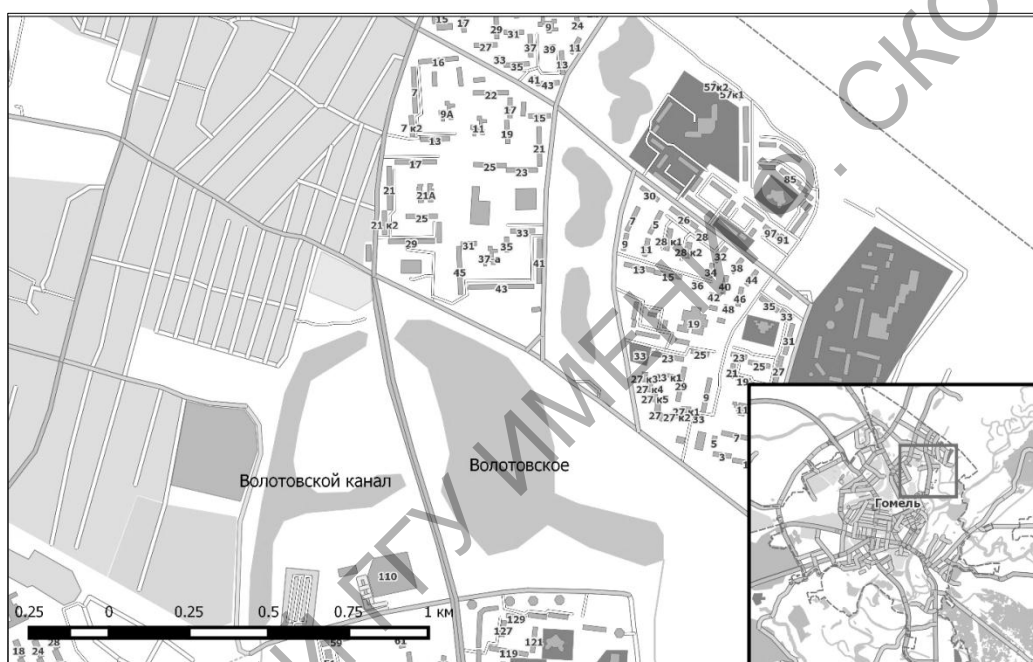
Рисунок 3. – Каскад Волотовских озер

Каскад озер «Волотовские» – группа озер старичного происхождения в Железнодорожном районе Гомеля. Окрестности этих озер словно самой природой предназначены стать излюбленным местом отдыха местных жителей. Близкое расположение к жилым домам делает озера популярными для отдыха как в летнее, так и в зимнее время. В каскаде три малых озера, на двух из которых есть благоустроенные пляжи. Территория вокруг озер благоустроена (рисунок 3).