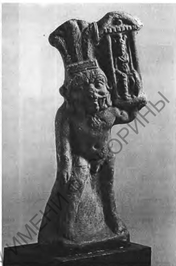
Рис. 10. Статуэтка Беса, держащего наос с Харпократом. I, 1а 4269. Глина. Выс. 10,5 см. Римский период

ного мужа (I, 1а 4275) (рис. 9), на другом — нежные супруги, обнявшись, стоят на папирусобразной колонне (I, 1а 4225) или веселятся под удары бубна (I, 1а 4254).