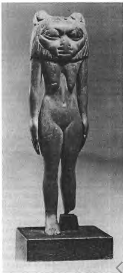
Рис. 1. Статуэтка жены Беса – Бесит. I, 1а 5669. Дерево. Выс. 10 см. Среднее царство