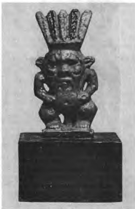
Рис. 7. Статуэтка Беса. I, 1a 4205. Фаянс. Выс. 6,5 см. XXVI династия