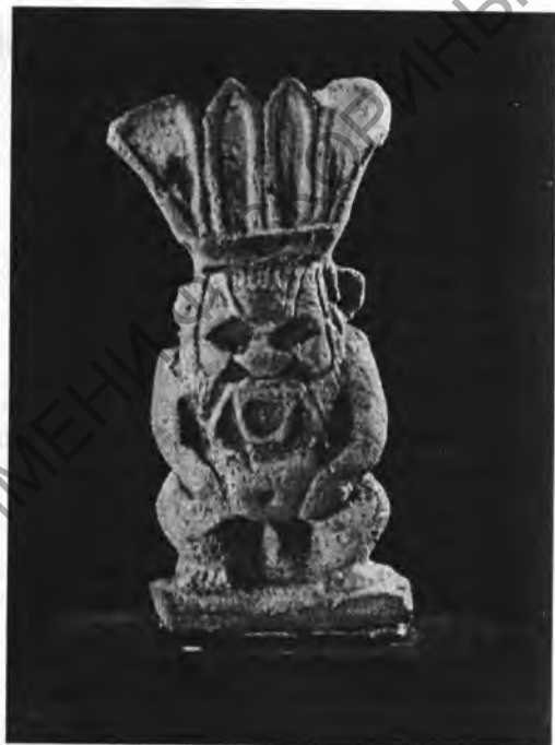
Рис. 6. Статуэтка Беса. I, 1а 4214. Фаянс. Выс. 6,2 см. XXVI династия

Бесы периода Рамессидов менее дружелюбны. Улыбка исчезла с их лица. Изображения стали схематичнее и условнее. Грива обозначается мелкими, помещенными один в другой прямоугольниками с закругленными краями, борода рисуется волнистыми линиями, условными линиями передаются морщины на лбу и щеках (I, 1а 5016).