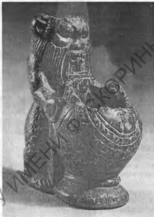
Рис. 2. Бес с сосудом. I, 1а 4215. Диорит. Выс. 6,9 см. Новое царство, XVIII династия

считать карликообразных существ на додинастических сосудах и карликов эпохи Древнего царства изображениями Беса, то фигурки этого бога на магических жезлах будут наиболее ранними его изображениями (I, 1а 4860) 4 .