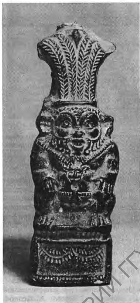
Рис. 5. Статуэтка Беса. I, 1а 4274. Глина. Выс. 9,5 см. XXVI династия