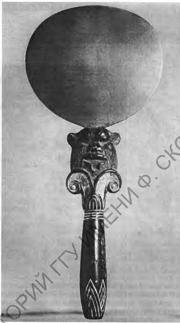
Рис. 3. Зеркало с ручкой в форме колонны с головой Беса. I. 1a 1735. Бронза, дерево. Выс. 28 см. Новое царство, XVIII династия

Статуэтки Бесит периода Среднего царства встречаются очень редко. Московская статуэтка имеет всего одну аналогию – костяную статуэтку Бесит из Дейр эль-Медина 7 .