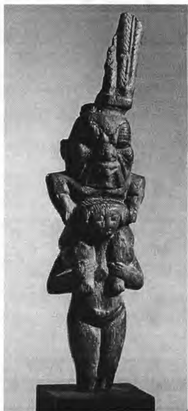
Рис. 9. Статуэтка жены Беса — Бесет с Бесом на плечах. I, 1а 4275. Дерево. Выс. 15 см. Период эллинизма.