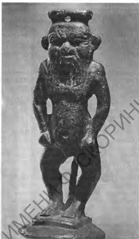
Рис. 8. Статуэтка Беса на папирусообразной колонне. I, 1a 4277. Бронза. Выс. 20,5 см. XXVI династия

связь бога с солнечными культурами, одним из символов которого был лев (I, 1a 4201). На еще одной бронзовой статуэтке Беса времени XXVI династии на его руке сидит бог Хор в образе сокола (I, 1a 4264). Согласно мифу Бес являлся воспитателем солнечного бога Хора.