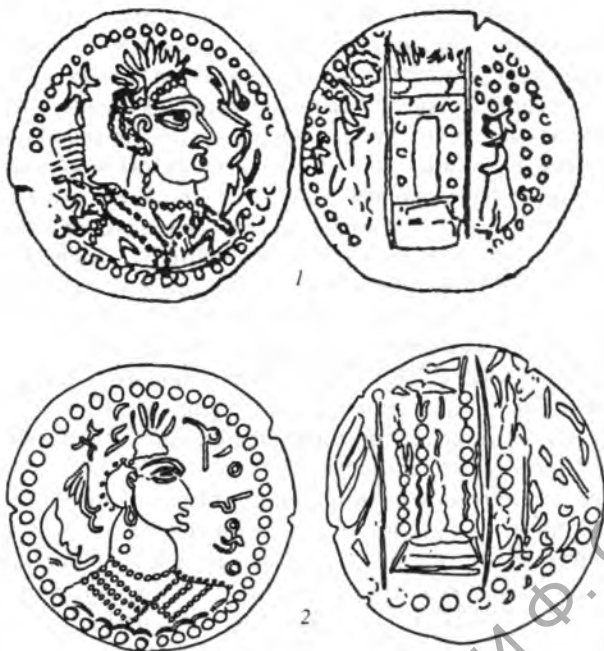
Рис. 4. Символ «лунной повозки» на монетах NAPKI MALKA (1) и князя Бамиана (2) (по: R. Ghirshman, 1948)

и на севере Индии – с указанным монетным чеканом АЛХОН , и в бывшей Бактрии, в Тохаристане – с чеканом ГОВОЗИКО ) и эфталитского княжеств, царства Кидары. Вместе с тем, Б.И. Вайнберг считала, что племенная группировка, чеканившая монеты с надписью ГОВОЗИКО и самостоятельной тамгой (S2 по Р. Геблю), вышла из объединения АЛХОН , и предположила, что в конце 80-х годов IV в. именно хиониты группировки ГОВОЗИКО сменяют власть кушано-сасанидских правителей в Бактрии-Тохаристане 54 . В связи с новой датировкой кушано-сасанидских монет очевидно, что данные рассуждения нуждаются в хронологической и исторической коррекции. Прежде всего следует говорить об удревнении этой группы монет и их относительной датировке серединой IV в. 55