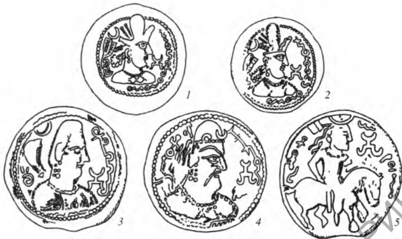
Рис. 3, 1–5. Символ «лунной повозки» на хионитских монетах (по: E. Specht, 1901; H.H. Wilson, 1971)

Шапура», но и с изображением всадника (группа С – монеты царей Забула, по Р. Гиршману) 49 (рис. 3, 5). Следует отметить, что среди хионитских (эфталитских) подражаний монетам Шапура II имеются монеты с тем же типом оборотной стороны, что и на вышеупомянутых кушано-сасанидских монетах Пероза и Хормизда – алтарь с божеством в пламени 50 . Это позволяет относительно синхронизировать данные группы монет и не предполагать большого промежутка времени между их выпусками, что также может указывать на некоторое омоложение даты правления кушаншахов Пероза и Хормизда (см. прим. 46).