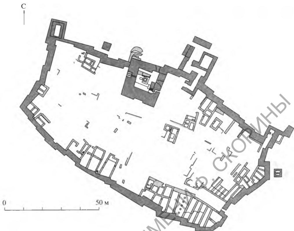
Рис. 1. Древний Сумхурам. Общий план городища

ще, так же как и интенсивные реставрационные работы, планируется провести на городище в последующие годы.