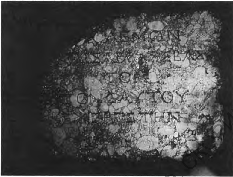
Рис. 1. Фрагмент плиты из Зелы с надписью Полемона I