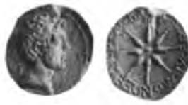
Рис. 3. Монета понтийского царя Полемона I (из коллекции В. Ваддингтона)

ние Понтийское царство, воссозданное им в 39 г. до н.э. Когда Полемон подавлял там вместе с Ликомедом из Понтийской Команы восстание Аршака, то уже имел титул царя (Strabo. XII. 3. 38), полученный при назначении в Киликию. Поэтому в следующем 36 г. до н.э., когда Марк Антоний отправился в неудачный поход против парфян, Полемон как царь Понта (πλὴν τοῦ Πολέμωνος τοῦ ἐν τῷ Πόντῳ βασιλεύοντος) принял в нем участие и сопровождал отряд Статиана, но попал в плен и был освобожден только за выкуп (Dio. Cass. XLIX. 25. 4; ср. также Plut. Ant. XXXVIII. 3: Πολέμων ἦν ὁ βασιλεὺς). Царский статус Полемона подтверждают крайне редкие монеты, легенды которых величают его царем (рис. 3) 36 . Среди них есть экземпляры с портретом Марка Антония и Августа, причем среди последних – одна с легендой ΚΑΙΣΑΡΟΣ ΣΕΒΑΣΤΟΥ, как и в надписи из Зелы, а другая с латинской надписью IMP. CAESAR AVG, выпущенная, очевидно, позднее, когда в 25 г. до н.э. принцепс получил аккламацию как император в восьмой раз (см. выше). Авторы каталога монет коллекции Ваддингтона считали эти монеты сомнительными, однако Р. Салливан совершенно справедливо усомнился в истинности такой оценки 37 . Как бы то ни было, монеты с легендой ΚΑΙΣΑΡΟΣ ΣΕΒΑΣΤΟΥ и ΒΑΣΙΛΕΩΣ ΠΟΛΕΜΩΝΟΣ подтверждают получение Полемоном I царского титула или скорее его подтверждение Августом в 26 г. до н.э.