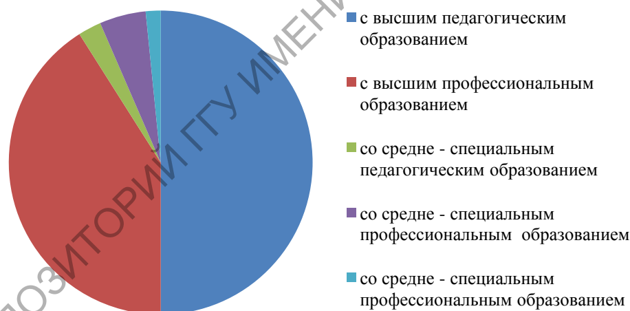
Рисунок 2 – Численность педагогов туристско-краеведческого направления по Республике Казахстан

В организациях образования республики работают 7 668 заместителей директоров школ по воспитательной работе, 18 402 педагога дополнительного образования, в том числе 851 педагога туристско-краеведческого направления (из них 698 с высшим педагогическим образованием; 42 с высшим профессиональным образованием, 84 со средне-специальным педагогическим образованием и 27 со средне-специальным профессиональным образованием (рисунок 2).