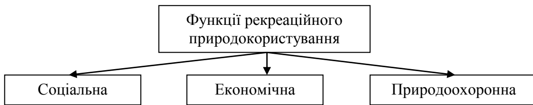
Рисунок 1 – Функції рекреаційного природокористування

Економічна функція полягає, головним чином, у відновленні робочої сили. Завдяки рекреації підвищується працездатність, збільшується фонд робочого часу, що сприяє зростанню продуктивності праці; розширюється сфера застосування праці; прискорюється розвиток соціальної й виробничої інфраструктури на територіях інтенсивного рекреаційного природокористування.