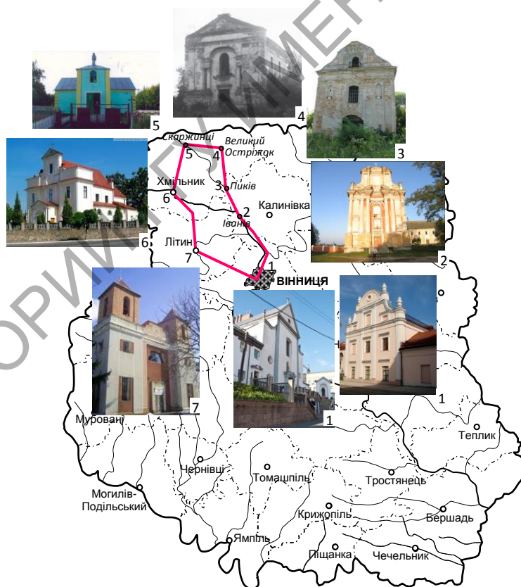
Рисунок 2 – Схема туристичного маршруту «Костелами північної Вінниччини»

Маршрут розпочинається у м. Вінниці, біля костелу Матері Божої Ангельської, що розташований на вул. Соборна 12, після вранішньої служби. Після екскурсії у Вінницькі храми виїжджаємо в сторону Пикова. Час поїздки займатиме приблизно 1 год 15хв, при відстані 52 км та дороги невисокої якості. У Пикові туристам пропонуємо відвідати костел Святої Трійці. Перший костел тут існував ще в 1604 р. Нинішній походить з 1774 р. і був збудований на пожертвування князя Антонія Любомирського, який також обладнав його [3].