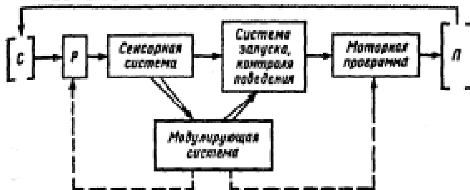
Рисунок 2 – Схема организации инстинктивного поведения:

Для каждого ключевого стимула в центральной программе поведения существуют механизмы запуска соответствующей поведенческой реакции, реализация которой не зависит от последствий для организма. Таким образом, пусковые стимулы воздействуют на поведение животных и заставляют их выполнять определенные инстинктивные комплексы действий, невзирая на воспринимаемую животным общую ситуацию. Инстинктивные реакции наделяют животных набором адаптивных реакций, которые находятся в состоянии «готовности» и возникают при первой же их необходимости. Богатый набор инстинктов создает явные преимущества для ряда низших животных, но особенно для животных с коротким сроком жизни (например, насекомые) или лишенных родительских забот.