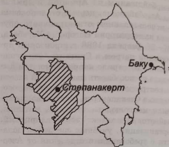
Рисунок 1 — Район Нагорно-Карабахского конфликта на карте Азербайджана

Всего в ходе конфликта погибло около 35 тыс. военных, членов добровольческих формирований и мирных жителей с обеих сторон.