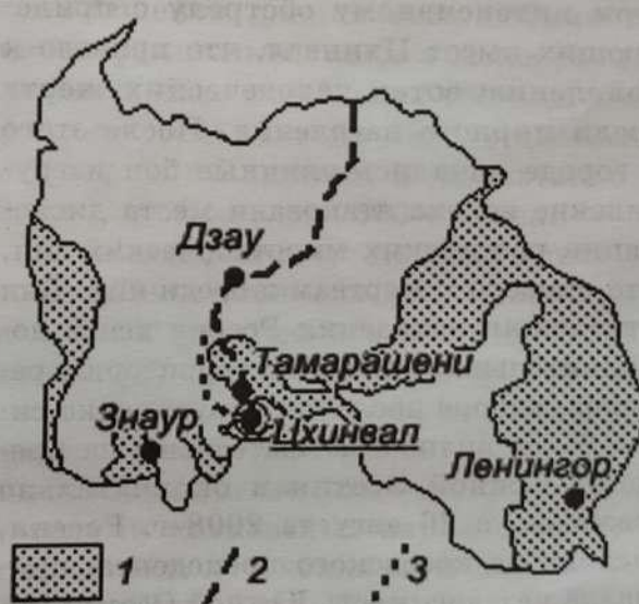
1 — территории, контролировавшиеся Грузией до 2008 г.; 2 — Транскавказская магистраль; 3 — Зарская дорога

Новые власти Грузии сразу взяли курс на ликвидацию такого положения,