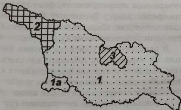
1 — Грузия; 1а — Аджария; 2 — Абхазия; 3 — Южная Осетия

Успешным для центральной власти Грузии силовым разрешением конфликта стало решение Аджарского кризиса 2004 г., когда удалось ликвидировать фактически не зависимый от Грузии