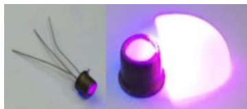
Рисунок 2 – Внешний вид корпусированных ЛФД или SiФЭУ с сцинтиляционным кристаллом (на основе боросиликатного стекла легированного \text{Eu}^{3+}\text{Y} ) в колпачке корпуса при воздействии УФ-излучения

На рис. 2 приведены внешний вид в корпусе ЛФД или Si-ФЭУ со сцинтиляционным материалом (боросиликатное стекло легированное \text{Eu}^{3+}\text{Y} ) залитым в колпачок – макет детектора ионизирующего излучения. Сцинтиллятор и детектор были прецизионно состыкованы друг с другом механическим способом, позволяющим быстро и надежно заменить как сцинтиляционный кристалл, так и сам детектор.