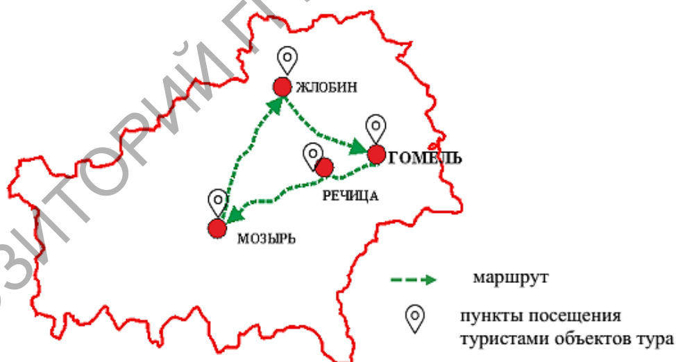
Рисунок 5 – Маршрут ремесленного тура «Саламянае шчасце»

Маршрут «Саламянае шчасце» (соломо- и лозоплетение) (рисунок 5).