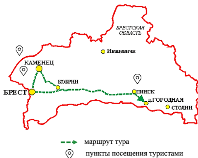
Рисунок 4 – Маршрут ремесленного тура «Гліняная казка»

1. Стартовая точка – г. Брест. Посещение Брестского областного краеведческого музея. 2. д. Городная, Столинский район, Брестская область. Посещение филиала Столинского краеведческого музея – Центра гончарства.