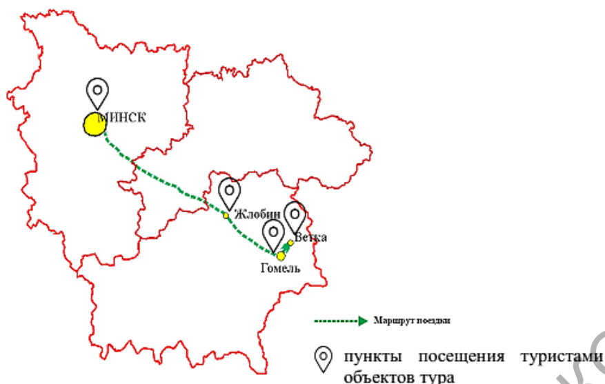
Маршрут ремесленного тура «Залатыя кросны» (рисунок 3).