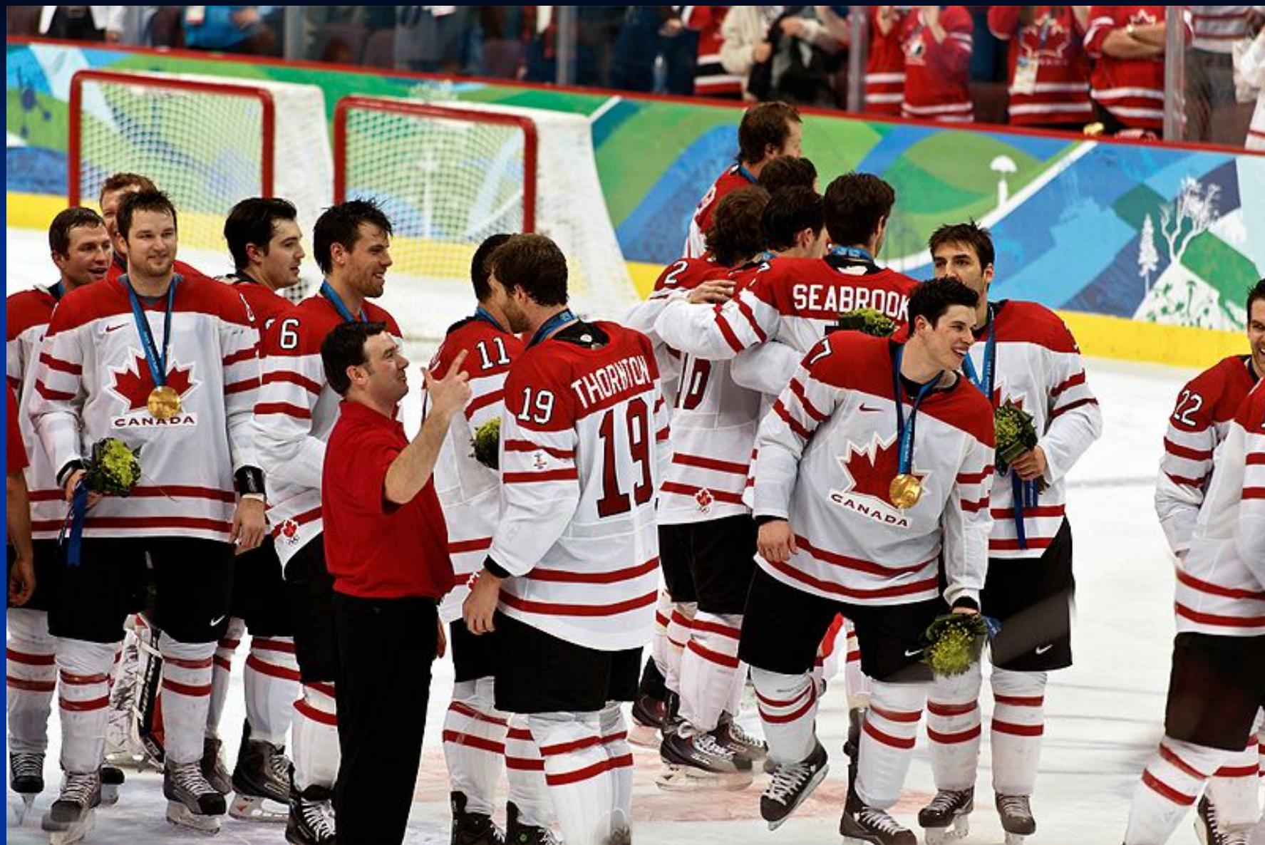
Олимпийские чемпионы 2010 — сборная Канады