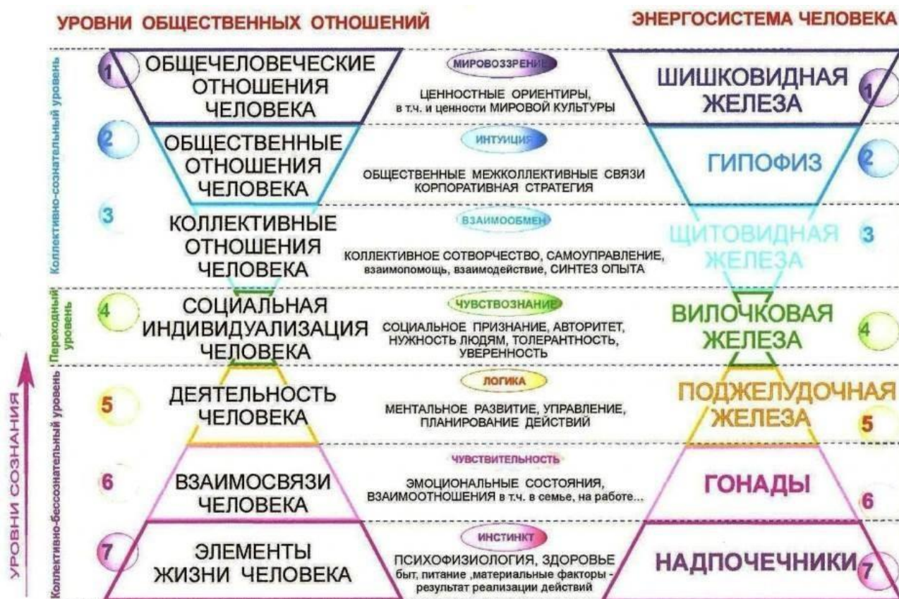
Рисунок 2 – «Универсальная модель здоровья и здорового образа жизни»

«здоровья», как состояния физического, эмоционального, ментального, социального, коллективного, общественного и общечеловеческого благополучия.