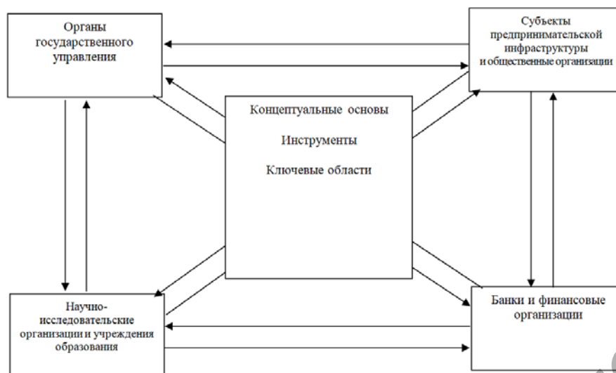
Рисунок 3 – Общая схема институциональной модели поддержки женского предпринимательства в Республике Беларусь

Реализация рассмотренных направлений развития поддержки женского предпринимательства в Республике Беларусь позволит: адаптировать зарубежный опыт в практику поддержки женского предпринимательства в Республике Беларусь посредством изменения взаимодействия институциональных субъектов; создать благоприятные условия для активизации женского предпринимательства; реализовать комплексную стратегически направленную поддержку женского предпринимательства; интегрировать в единый механизм действующие институциональные элементы в направлении поддержки женского предпринимательства.