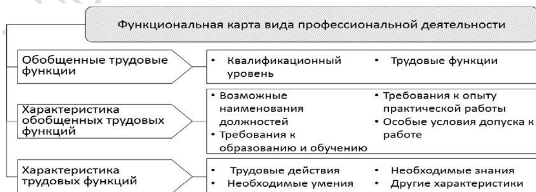
Рисунок 3 – Содержание классификационных характеристик работников согласно профессиональному стандарту

Новая структура нормативных документов, описывающих квалификационные показатели, ориентирует работодателей на название должности, по которой работник будет выполнять трудовые функции, на его образование и опыт работы (рисунок 3) [2].