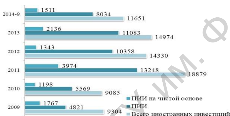
Рисунок 2 – Привлечение прямых иностранных инвестиций за период январь – сентябрь 2009-2014 гг., млн. долл. США [2]

Помимо высокой доли инвестиций в оборудование, инновационная деятельность также характеризуется ее высокой концентрацией в небольшом количестве отраслей. Совокупная доля перечисленных отраслей в общих расходах на инновации достигает 83,2%. Непосредственное привлечение иностранных инвестиций за девять месяцев 2014г. составило 11 651 млн. долл. США, из которых на долю прямых иностранных инвестиций на чистой основе (без учёта задолженности прямому инвестору за товары, работы, услуги) приходится 1 510,9 млн. долл. США (рисунок 2).