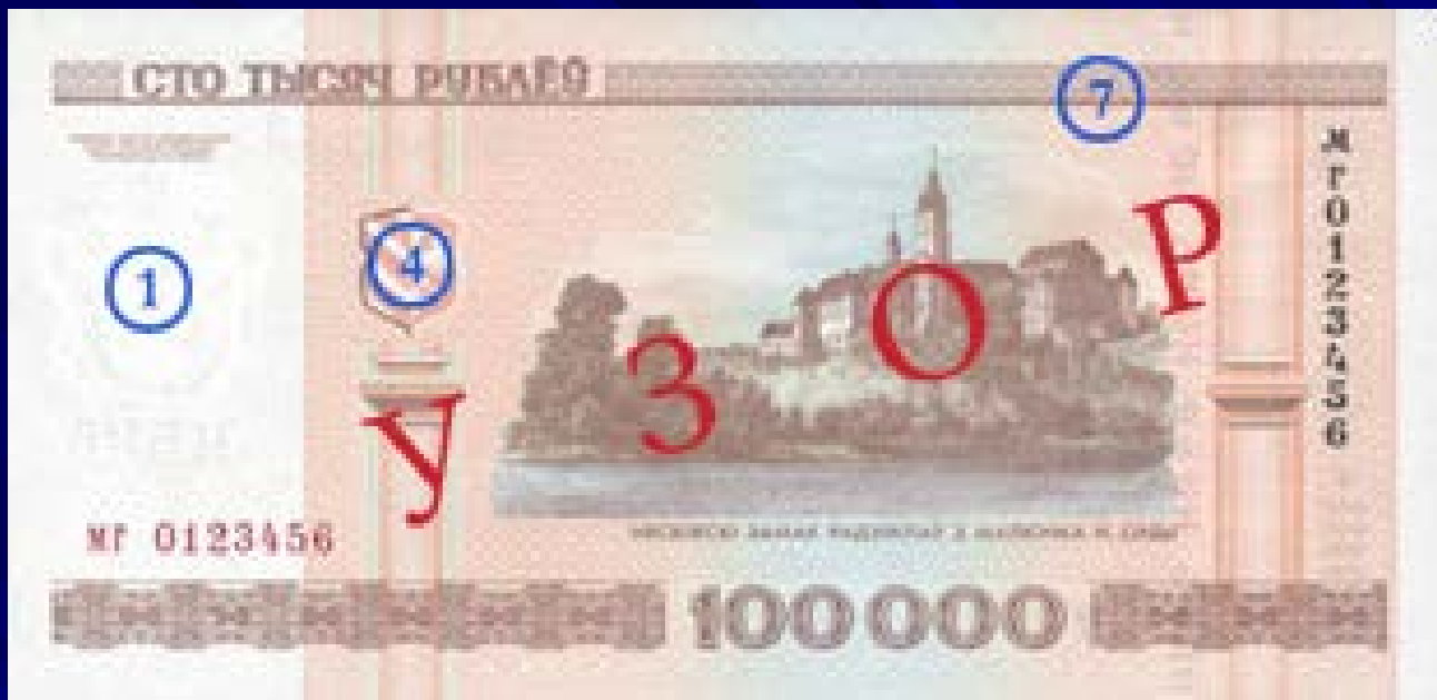
Оборотная сторона: Вид несвижского замка Радзивиллов с картины Наполеона Орды