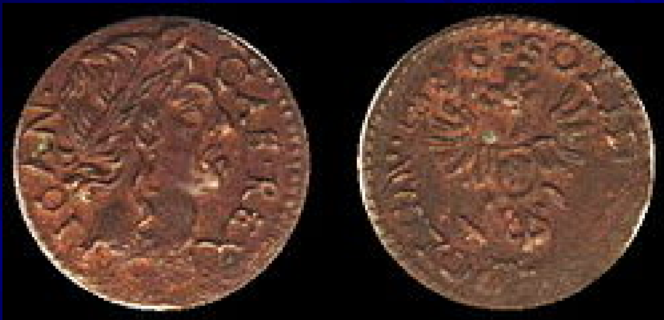
Медный солид (боратинка) 1648 г.