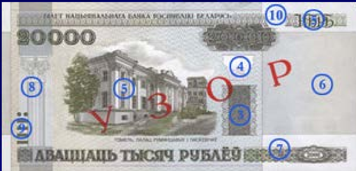
Лицевая сторона: Гомель. Дворец Румянцевых и Паскевичей

Номинал: 20 000 рублей Введена в обращение 15 марта 2011 г. Размер банкноты: 150 x 74 мм