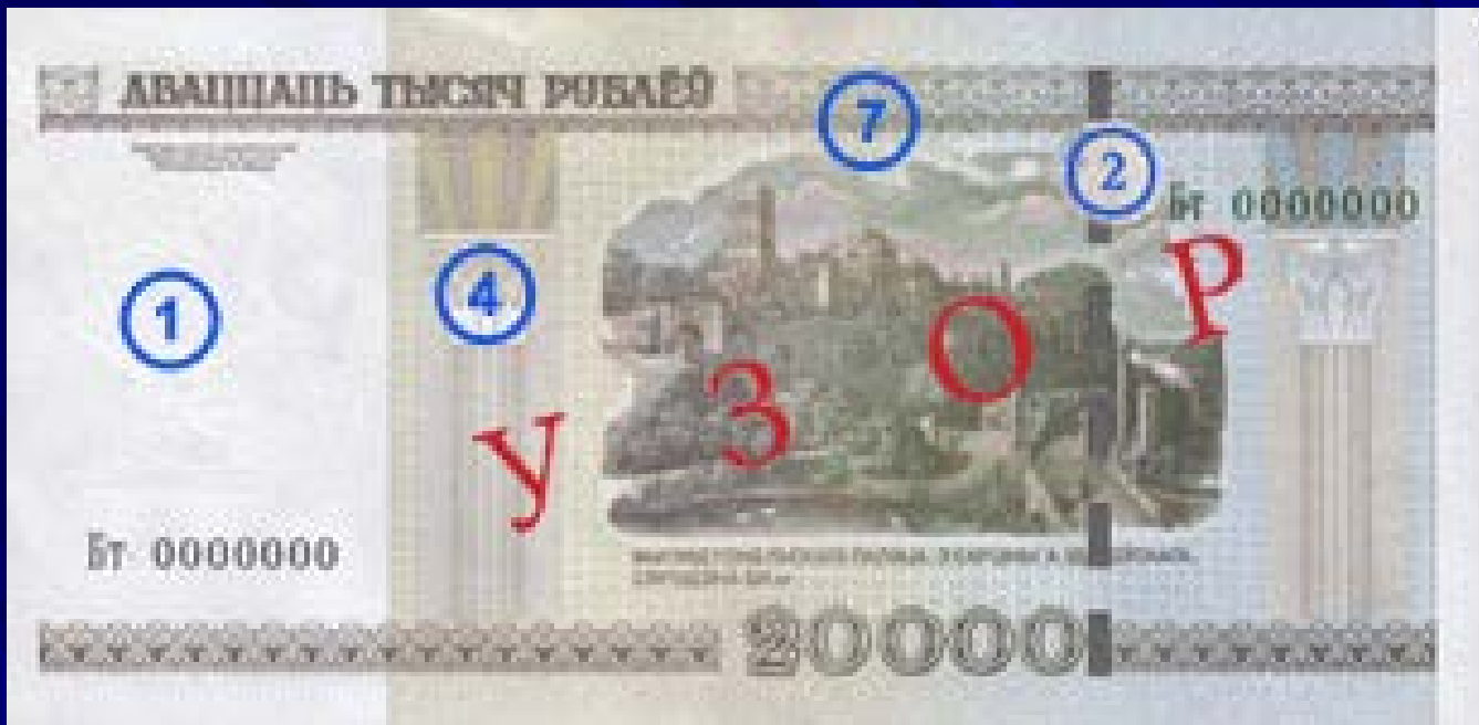
Оборотная сторона: Гомель. Вид дворца с картины А. Идзковского