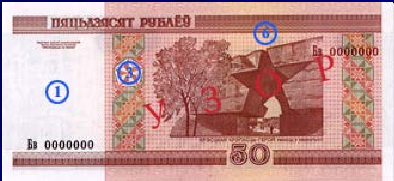
Оборотная сторона: Главный вход в мемориал "Брестская крепость–герой"