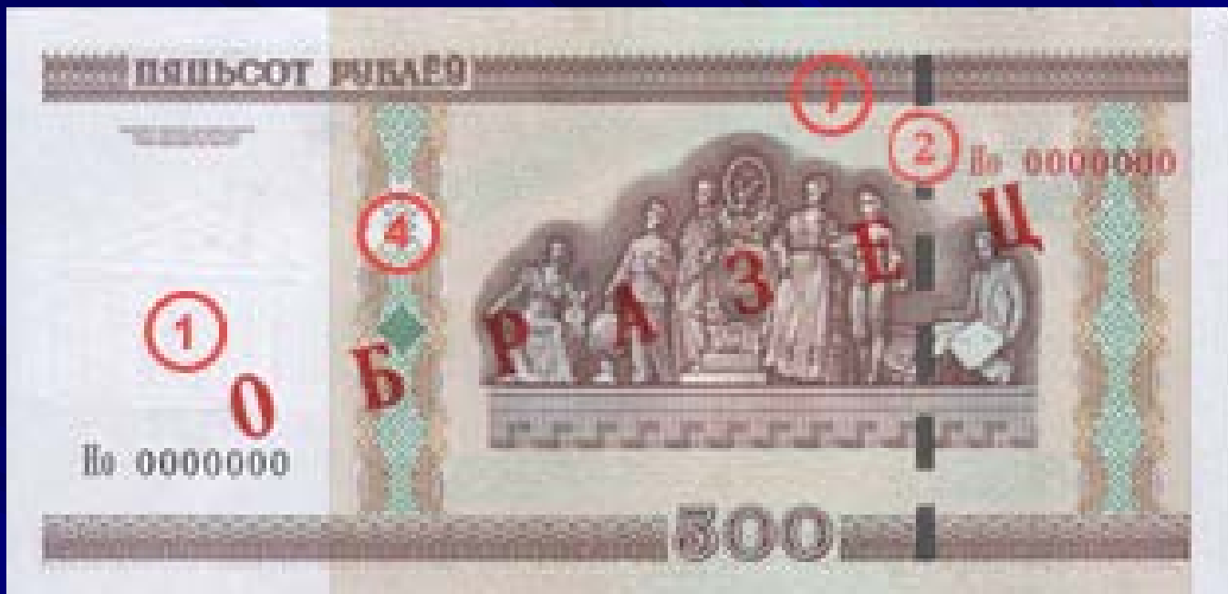
Оборотная сторона: Скульптурная группа фронтона Республиканского Дворца культуры профсоюзов