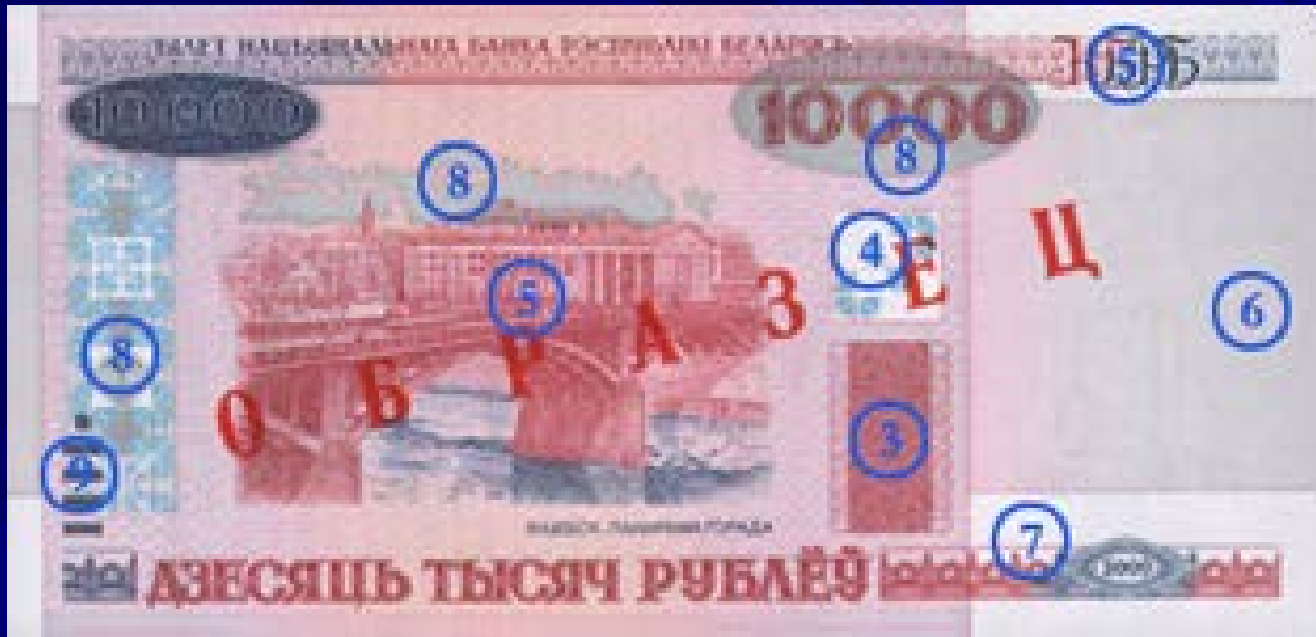
Лицевая сторона: Витебск. Панорама города

Номинал: 10 000 рублей Введена в обращение 15 марта 2011 г. Размер банкноты: 150 x 74 мм