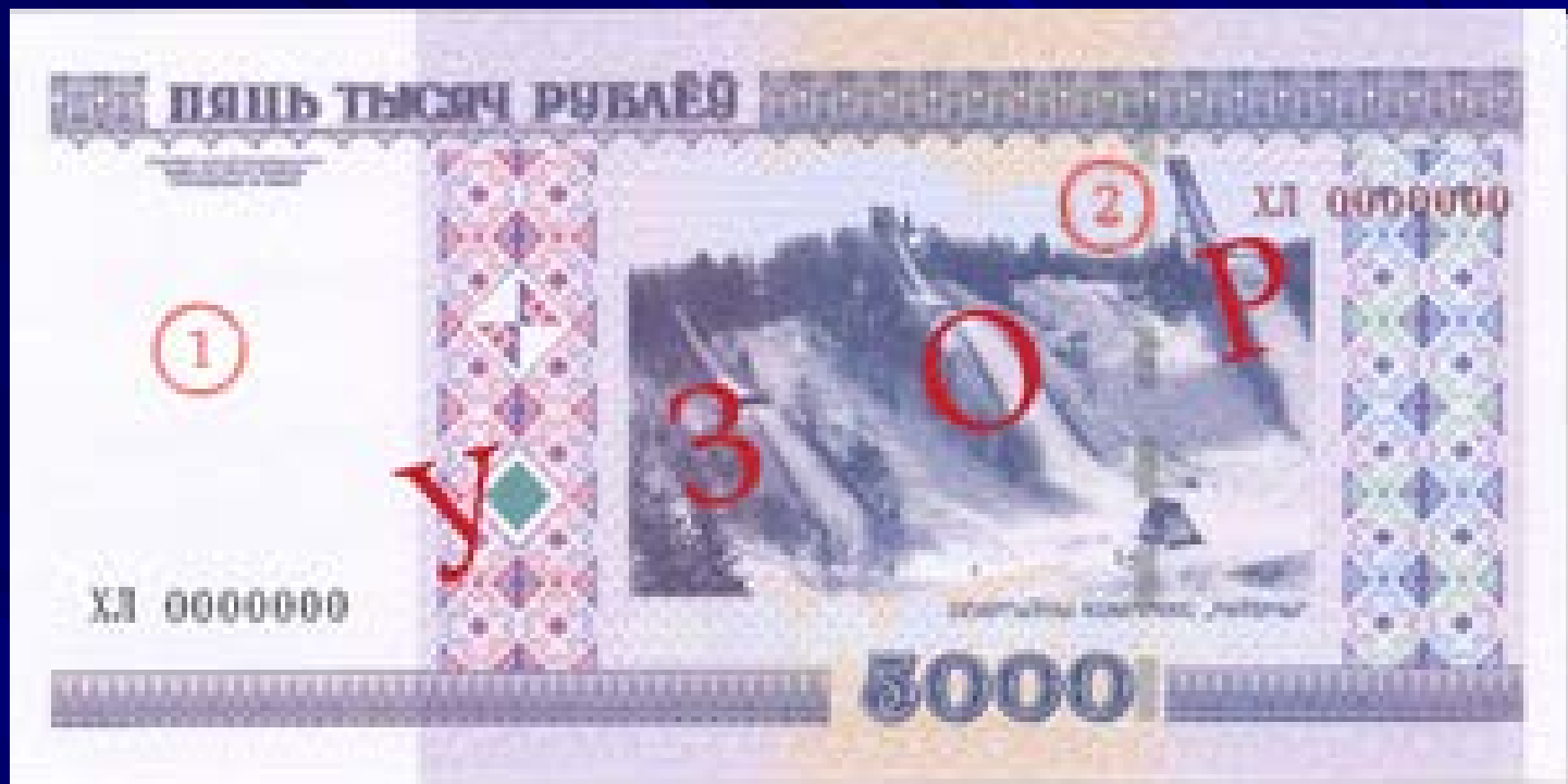
Оборотная сторона: Спортивный комплекс "Раубичи"