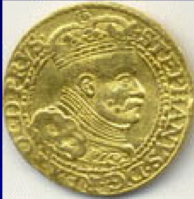
Дукат 1586 г. Стефан Баторий