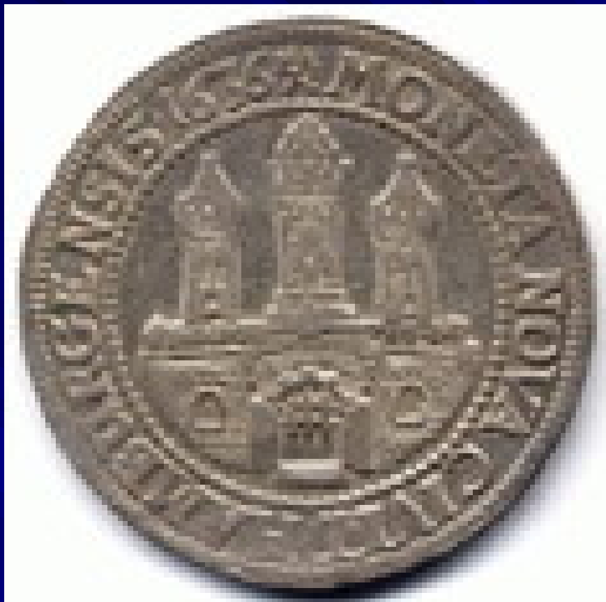
Талер 1636 г.