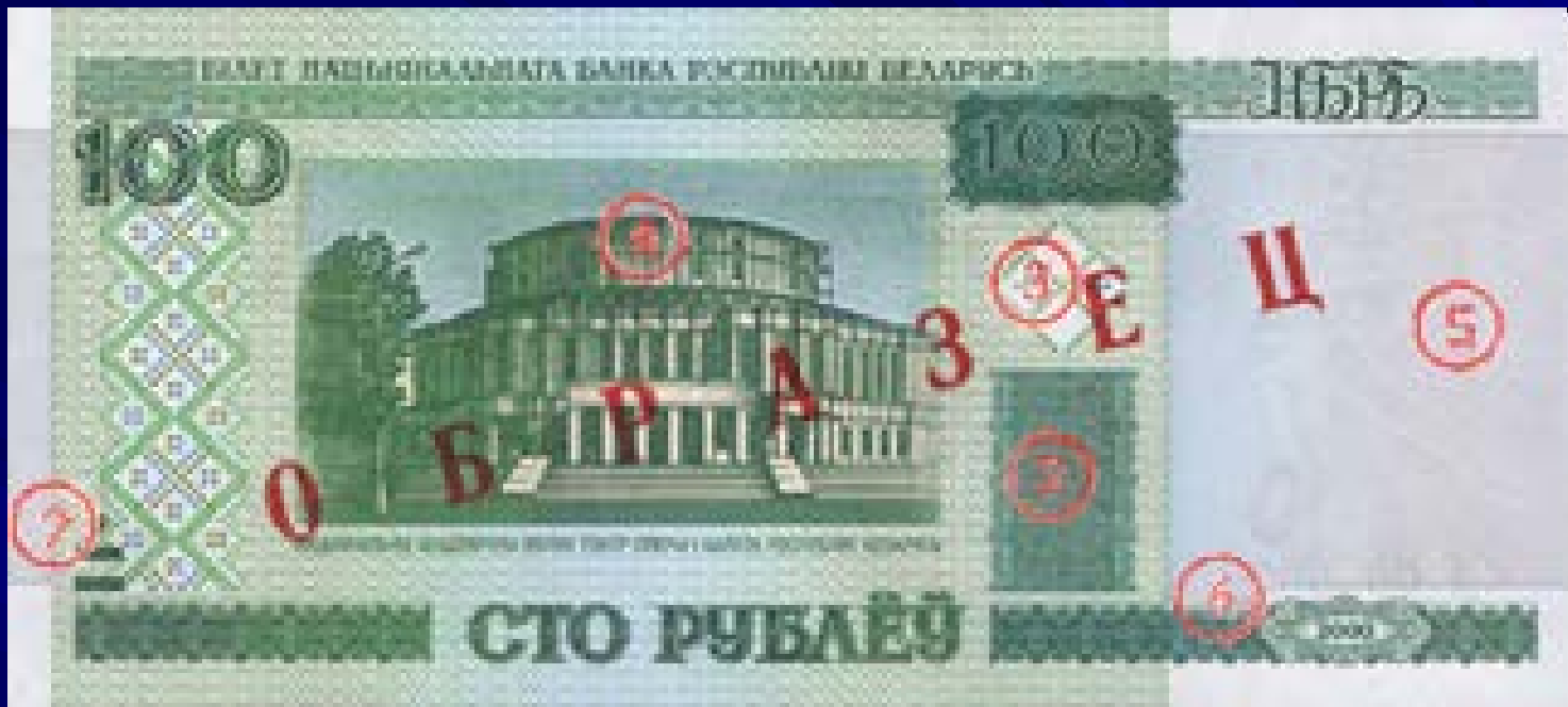
Лицевая сторона: Национальный академический Большой театр оперы и балета