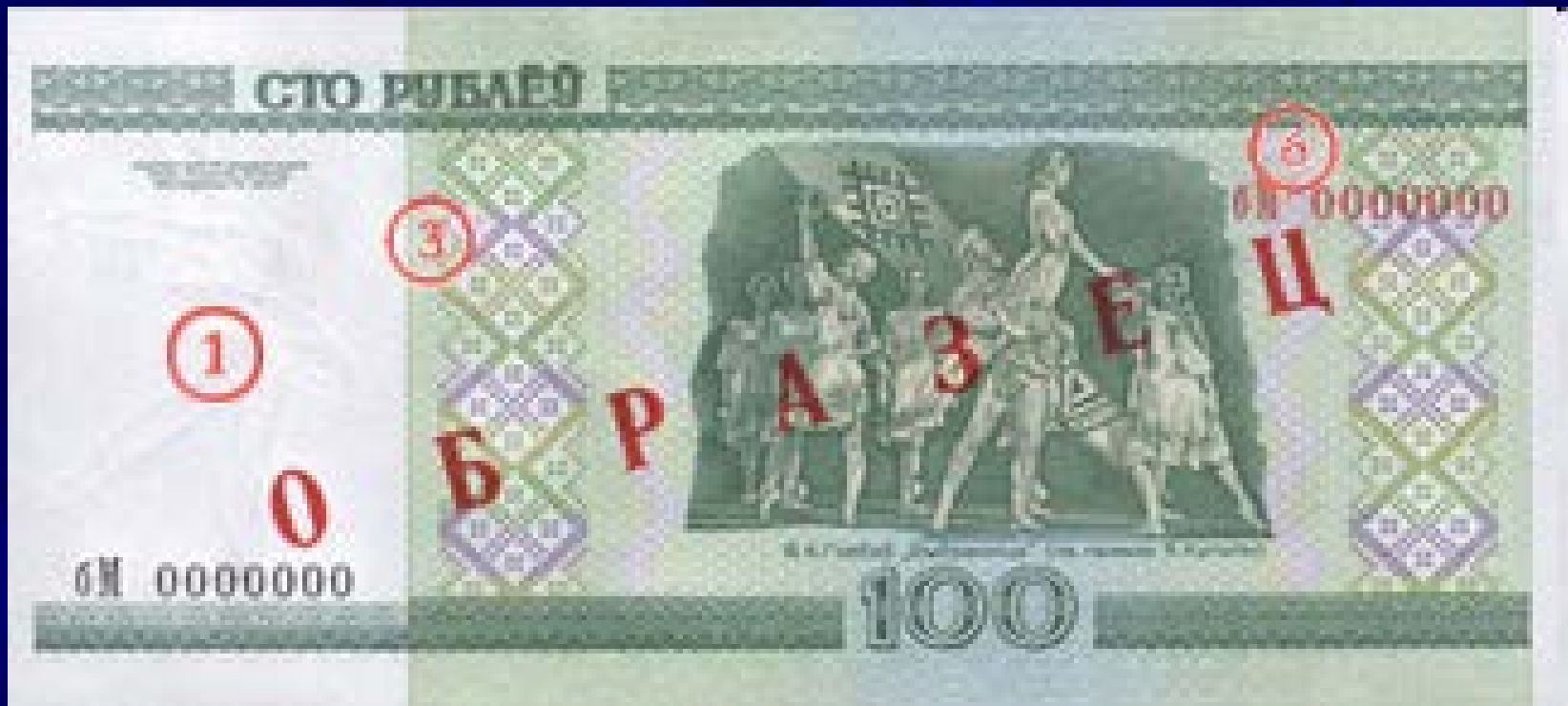
Оборотная сторона: Сцена из балета Е.А.Глебова "Выбранніца"