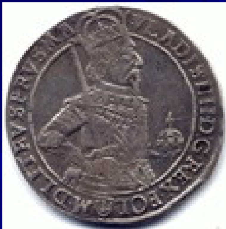
Талер 1634 г.