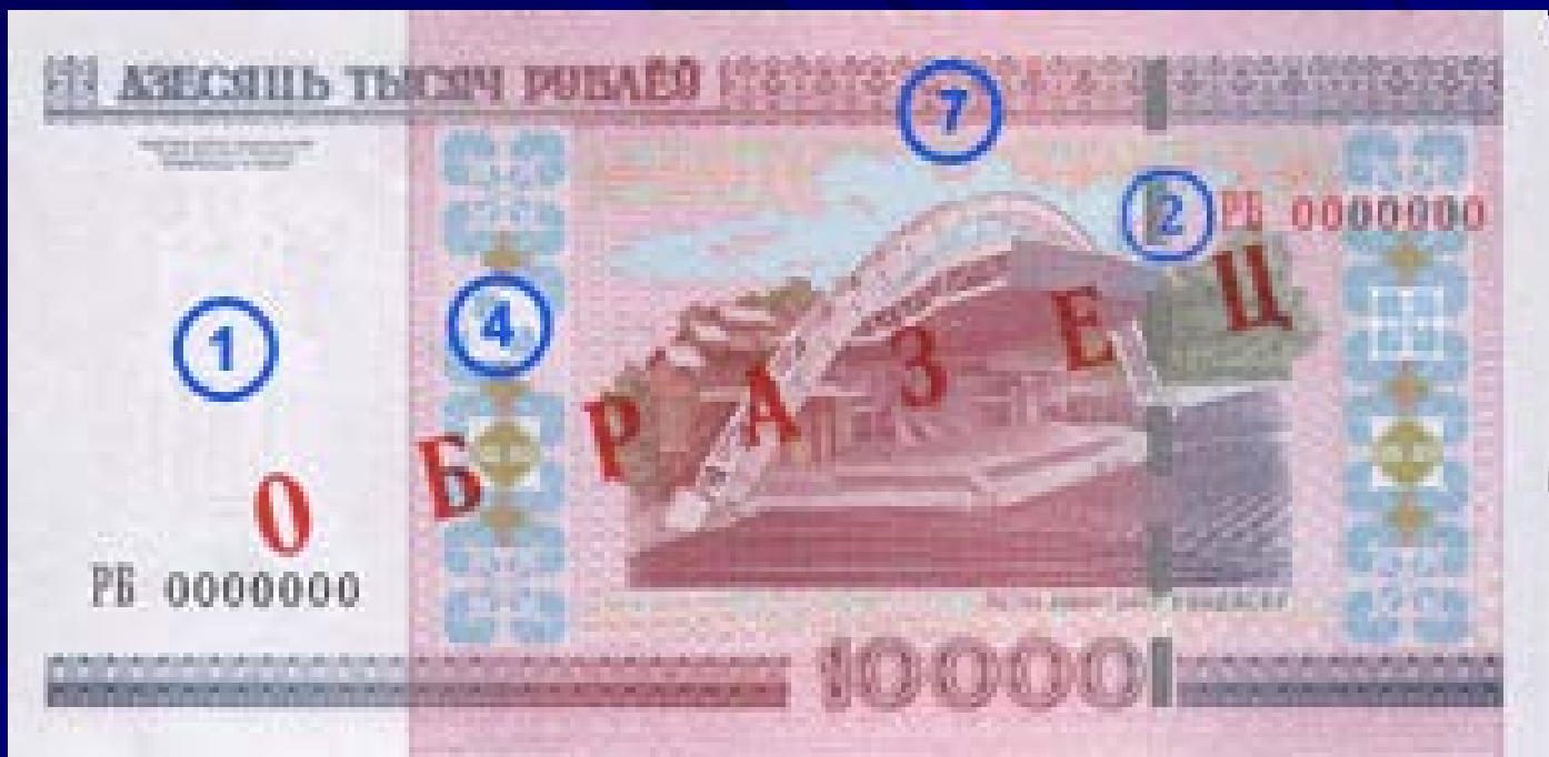
Оборотная сторона: Летний амфитеатр в Витебске