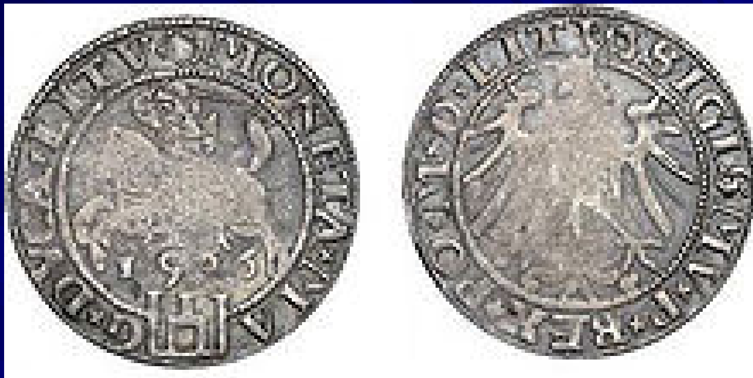
Литовский грош 1536 г.