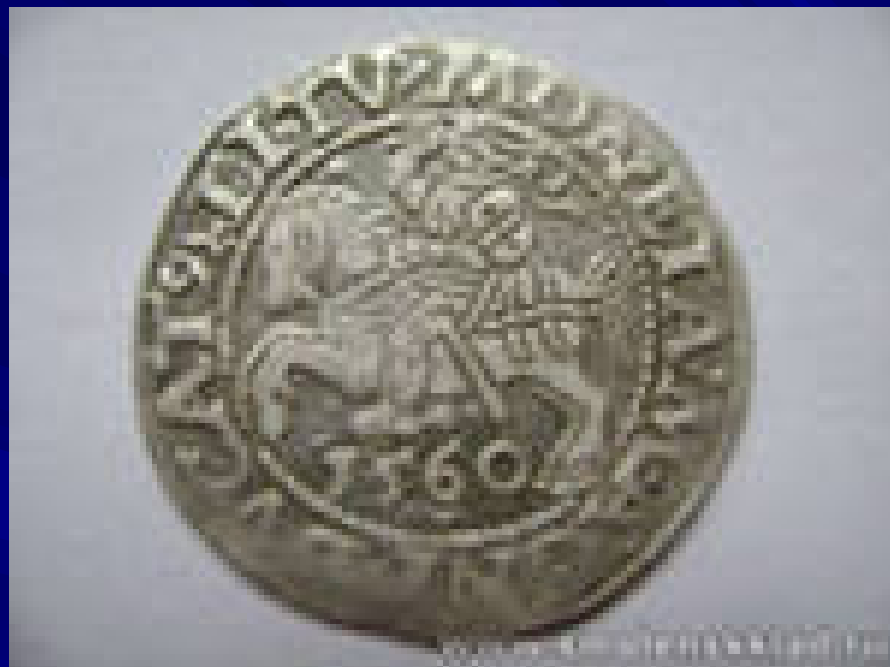
Талер 1560 г.