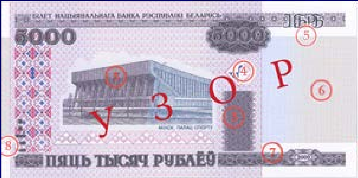
Лицевая сторона: Дворец спорта в Минске

Номинал: 5 000 рублей Введена в обращение 25 июля 2011 г. Размер банкноты: 150 x 74 мм