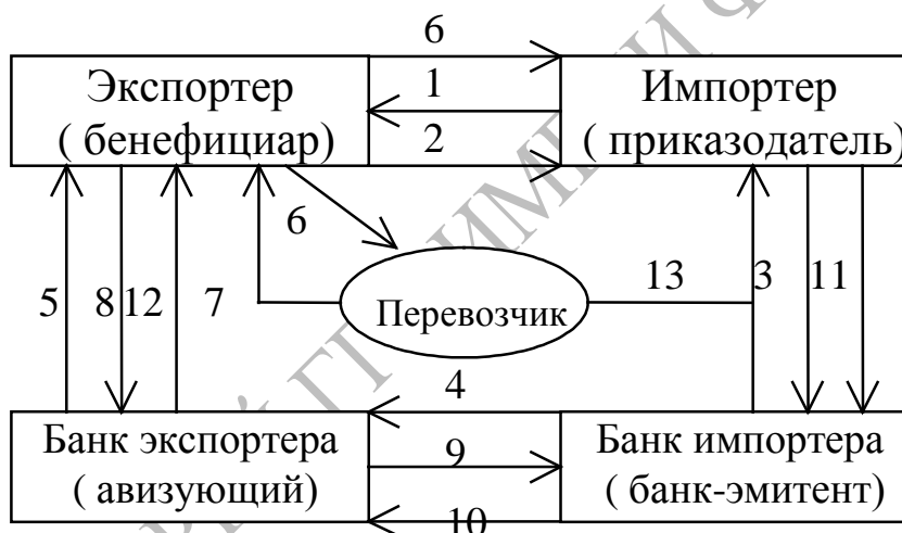
Рисунок 7 – Механизм и последовательность операций при аккредитивной форме расчетов во ВЭД

Наибольшее распространение использование аккредитива при расчётах получило при осуществлении ВЭД. Механизм и последовательность операций при аккредитивной форме расчетов во ВЭД представлен на рисунке 7.