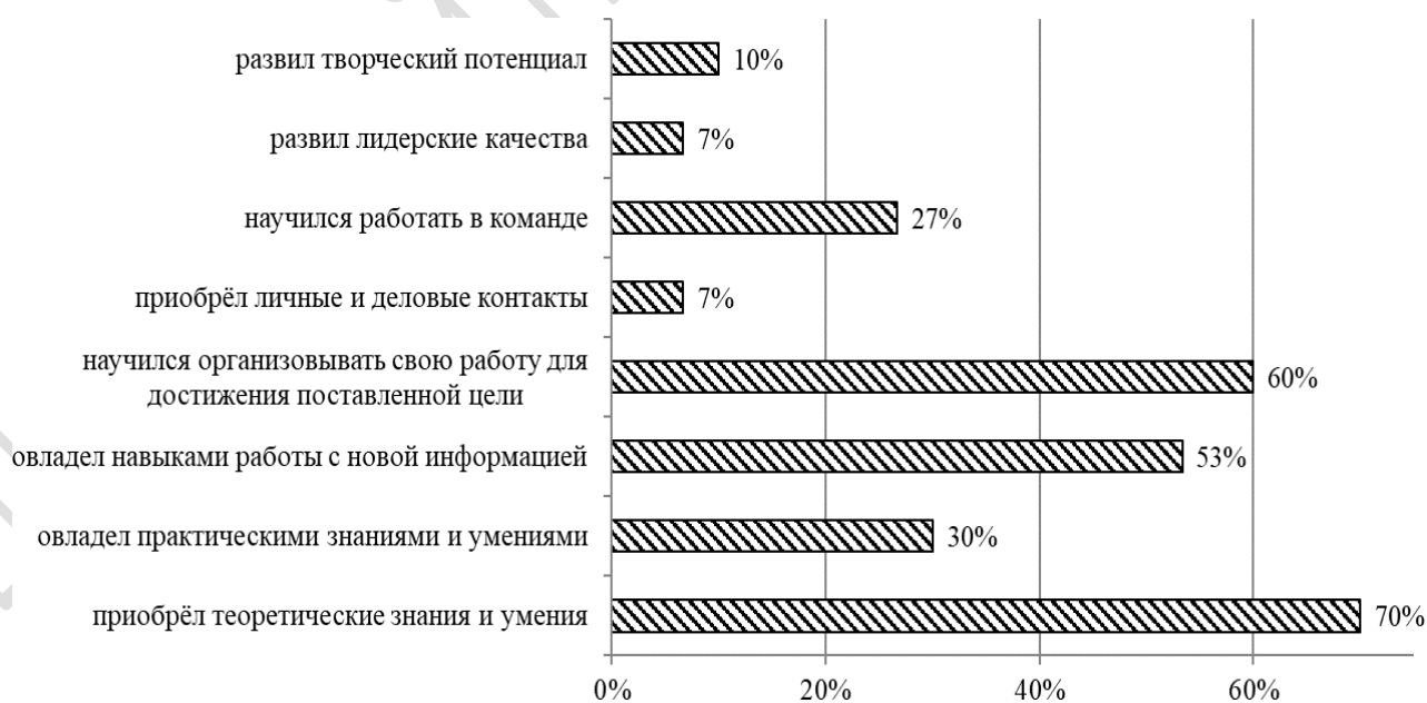
Рисунок 2 – Какие результаты, полученные Вами при обучении в университете, являются самыми значимыми?

Следует заметить, что к моменту окончания бакалавриата этим же студентам было предложено ответить на ряд вопросов, касающихся их профессиональной готовности. Среди вопросов был «Какие результаты, полученные Вами при обучении в университете, являются самыми значимыми?». Ответы студентов представлены на рисунке 2.