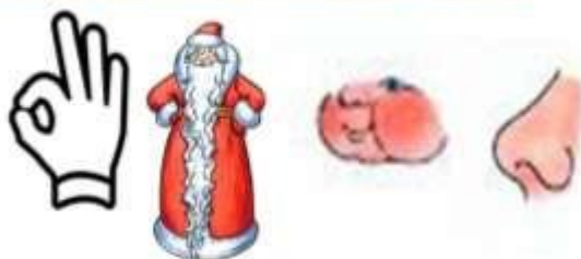
Рисунок 2 – Упражнение «Вспомни скороговорку» для развития связной речи у учащихся с интеллектуальной недостаточностью на уроках литературного чтения в IV классе

В рабочую тетрадь включены также упражнения, направленные на развитие мышления учащихся, которые предполагают развитие умения рассуждать и делать необходимые выводы, устанавливать и восстанавливать логическую последовательность событий. С этой целью используются следующие упражнения: «Загадка», «Ребус», «Выбери рисунки», «Найди ошибки в тексте», «Восстанови последовательность», «Соедини картинку с названием произведения», «Придумай план рассказа». Например, в упражнении «Выбери рисунки» учащимся предлагается сначала из предложенных картинок выбрать только те, которые по смыслу подходят к тексту, а затем придумать предложения к выбранным картинкам.