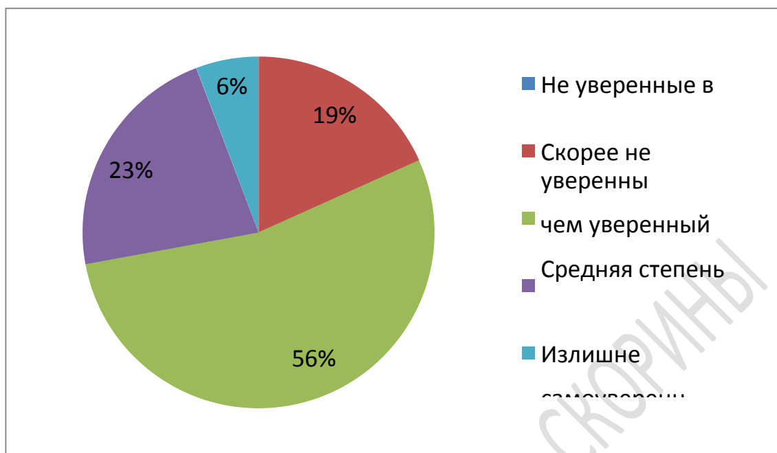
Рисунок 1 – Количественные показатели уровня уверенности в себе у студентов, в %

Уровень излишне самоуверенных составляет (6%) испытуемых. Они не испытывают страха, поэтому зачастую ведут себя безрассудно и рискованно. Например, человек недооценивает риск для своего здоровья и уверен, что алкоголь и никотин не навредят ему. Самоуверенные люди пренебрежительно относятся к окружающим и это мешает выстраивать отношения. Нередко излишняя самоуверенность оборачивается неоправданными надеждами.