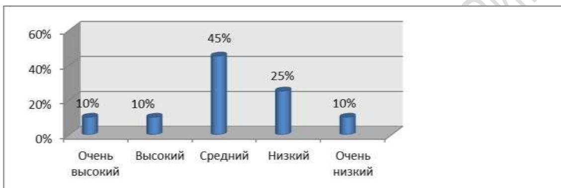
Рисунок 1 – Уровень познавательной активности старших дошкольников

Для более детального сравнения показателей уровней познавательной активности старших дошкольников, представим результаты исследования в виде диаграммы (рисунок 1).