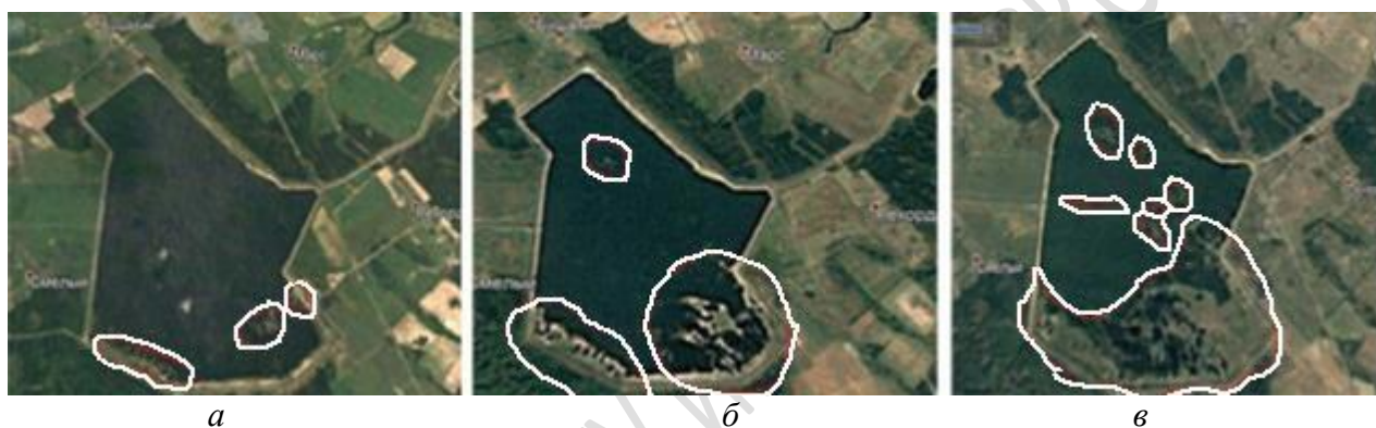
Рисунок 2 – Территория водохранилища в 1997 (а), 1999 (б) и 2003 (в) годах

В 1996 году водохранилище повторно заполнили, и все участки суши снова оказались под водой. Но начиная с 1997 года отмели в южном плесе появляются снова, и их площадь постоянно увеличивается, достигая максимума к 2003 году ( рисунок 2 ). На участке суши в районе восточного берега идет формирование растительного покрова, постепенно растительность распространяется на острова и полуострова южного плеса. К 2003 году большинство территории покрыто травяным покровом, вдоль восточного берега активно формируется древесно-кустарниковый ярус. В 2004 году водохранилище снова заполняют водой. Нормальный уровень держится до 2007 года, затем обмеление продолжается.