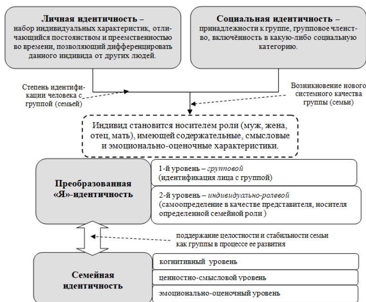
Рисунок 1 – Механизм формирования семейной идентичности

Примечание: рисунок составлен автором на основе источника [3].