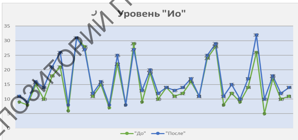
Рисунок 2 – Показатели общей интернальности подростков до и после проведенной работы по развитию нравственной устойчивости подростка

Как изменился уровень общей интернальности изображено на рисунке 2.